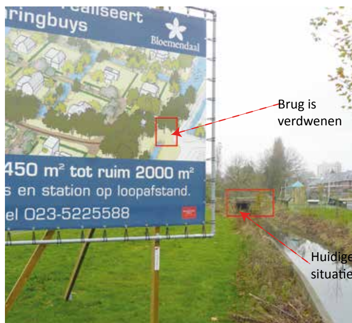
Plan Haringbuys. Op de plantekening is het tramtracé in donkerrood gekleurd. De te slopen trambrug rechts op de achtergrond in het rode vak.

In 2012 wilde Heemstede niet meebetalen aan de noordelijker gelegen nieuw te bouwen provinciale fietsroute over de Houtvaart.