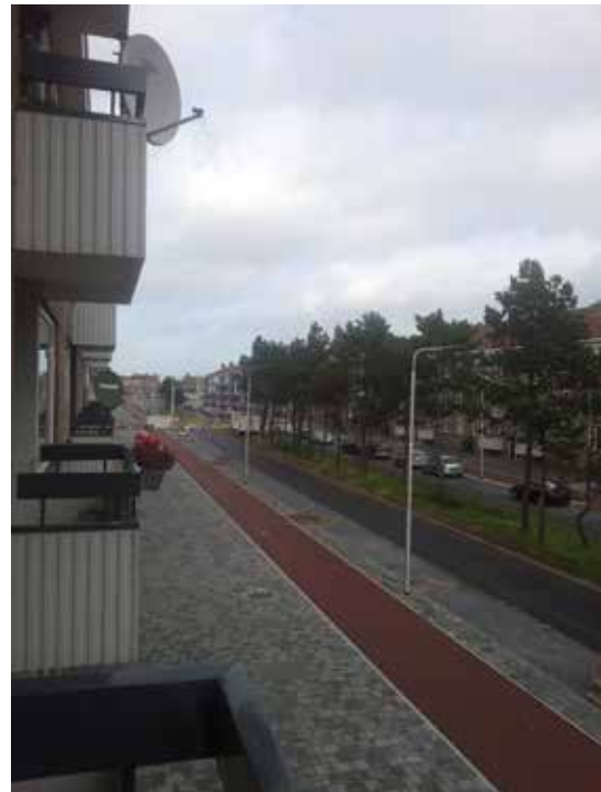
Planetenweg, foto: Marcel Griekspoor