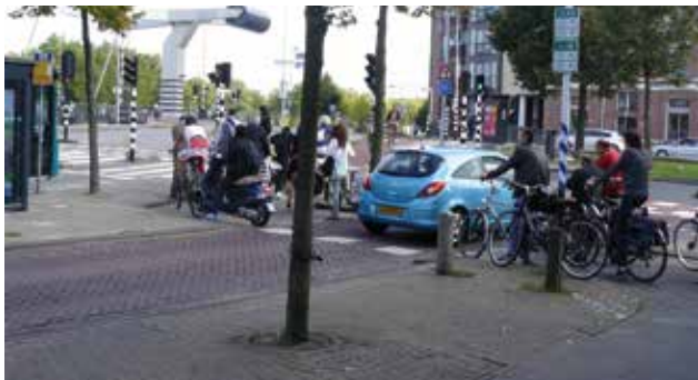
Turfmarkt, september 2012 niet zo .....

Een mooi succes voor de Fietzersbond. Wij hebben jaren gewerkt aan het oplossen van dit knelpunt. De Turfmarkt zou aanvankelijk in 2004 (ja, u leest het goed!) worden opgeknapt. Toen kwam de tunnelstudie voor de Zuidtangent, en het alternatief daarvoor: een verbrede Lange Brug. Daarop zou zelfs aan beide zijden een tweerichtingen fietspad komen. Maar dat plan ging ook niet door. Vier jaar geleden lobbyden wij bij de gemeenteraad en deze nam een motie aan