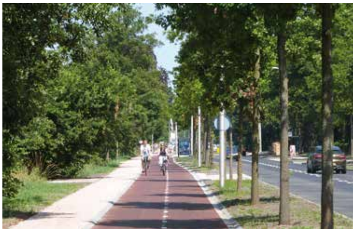
Herenweg tweerichtfietspad Herenweg aan de westzijde, foto: Eelco Langerijs

De laatste fase van de Herenweg, tussen Rijnlaan en grens Bennebroek, is helaas uitgesteld tot na 2016. Voorlopig blijft het oncomfortabel op de matig onderhouden tegelverharding en ontbreken vluchtheuvels om in fases over te steken bij de Prinsenlaan, Manpadslaan en ingang Groenendaalse Bos. Dus: kijk goed uit wanneer je in één keer de rijbaan moet oversteken!