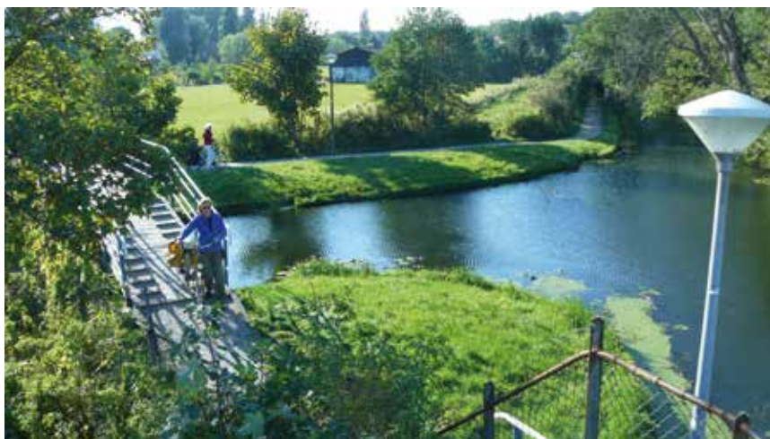
Fietsers zullen blijven fietsen op het Houtmanpad. Links van het voetpad, achter de haag, het geplande fietspad.

Het College besloot echter toch te stoppen. Nu blijkt ook nog eens dat de provinciale subsidie van 1,7 miljoen nog maar de helft waard blijkt te zijn (€ 850.000). Dat is tamelijk bizar. De gemeente heeft ten onrechte de ambtenarenuren meegeteld als zijnde subsidiebel. Opnieuw een blunder dus. Met € 750.000 Stedelijke Vernieuwingsgelden (ISV) wordt het stoppen van het project gedekt. Het lijkt mij toch dat er verantwoording moet worden afgelegd over de besteding. Iets niet-realiseren is toch niet de bedoeling van de ISV gelden. Oftewel: er kan nog wel eens een rekening van het rijk komen; "of Haarlem die 7,5 ton wil terugstorten". Nee, niet de Fietsersbond, maar de gemeente is de trieste verliezer. Het gevolg is nu dat voetgangers en fietsers elkaar 'in de weg blijven zitten' op het smalle schelpenpad.