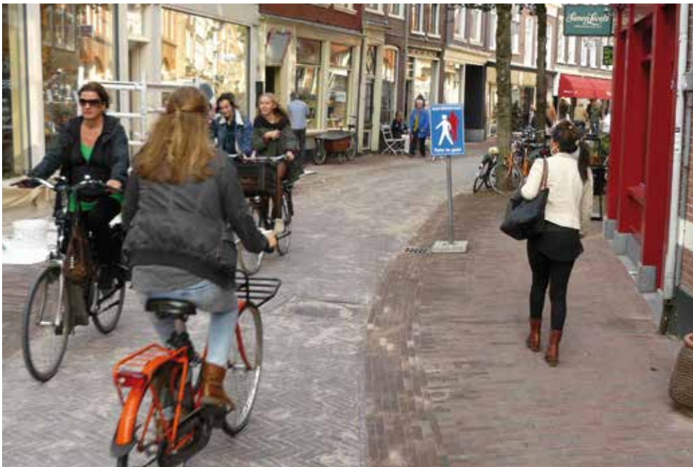
De 'nieuwe' Gierstraat, foto: Jaap Moerman

Jammer is het dat op het fietsgedeelte de oude hobbelige klinkers zijn teruggelegd. Het voetgangersgedeelte heeft nieuwe rode klinkers gekregen. Voor de fietser was geen geld meer..