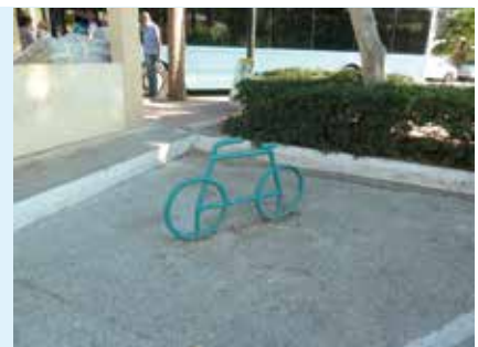
Valetta, Malta, foto: Mieke van Rooij

Met 400.000 inwoners en 250.000 auto's is Malta een mekka voor de automobilist, als je het tenminste niet erg vindt dat je bijna altijd in de file staat en de luchtverontreiniging voor lief neemt. De fietser is niet helemaal afwezig, al is het voor het merendeel door middel van dit soort standbeeldjes. De fietsers zelf zie je bijna alleen 's morgens heel vroeg en in dun bevolkte plaatsen op het eiland.