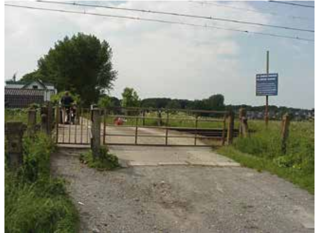
De overweg in 2005

veel ouder te zijn dan gedacht en al sinds de aanleg van de Leidse trekvaart en het jaagpad te bestaan, als 'voorlaan' van de buitenplaats Boekenrode. Dat valt te lezen in een aparte historische bijlage bij het bezwaar.