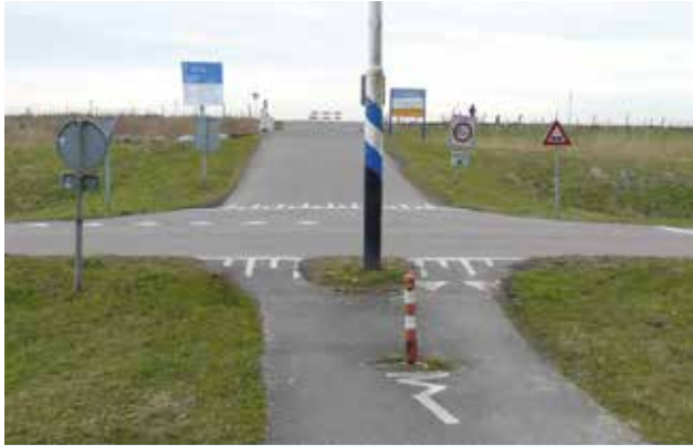
Debiel paaltje op fietspad bij Houtrak Spaarnwoude, foto: Jaap Moerman Denkt de wegbeheerder met dit rood-witte paaltje automobilisten van het fietspad te weren? Of wil het paaltje de fietser waarschuwen voor groter onheil? Namelijk een nog grotere paal op het fietspad. Ik weet niet waar ik liever tegen aan bots.

is twee jaar geleden opgeknapt met kunststof kistjesonder het asfalt om de boomwortels geen kans meer te geven het wegdek omhoog te duwen. Dat was een hele dure oplossing: als het had geholpen,