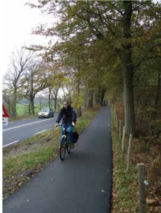
Nieuw asfalt op fietspad Vogelenzangseweg

vonden dat de rijbaan hun domein was en fietsers daar niet thuishoorden. Met het plaatsen van waarschuwborden, die op ons verzoek zijn voorzien van onderborden met de tekst "fietsers op de rijbaan", hopen we dat de acceptatie door automobilisten verbetert. We verwachten dat het daardoor het voor de snelle fietsers veiliger wordt.