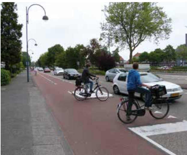
Heemsteedse Dreef: overstekende scholieren Postlaan, foto: Eelco Langerijs Kwakelbrug, Heemstede

De 'bottleneck' bij de Kwakelbrug is de doorvaart voor de Pakjesboot 12. Voor de kleine recreatieve pleziervaart is verlaging van de brug geen bezwaar. Vermoedelijk zullen de Zwarte Pieten wel met iets slims komen zodat Sinterklaas ongehinderd de Haven in Heemstede kan aandoen.