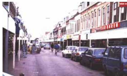
Archieffoto Cronjéstraat: auto's en fietsers delen de weg en de parkeerplaatsen. Ook het toeleverende vrachtverkeer moet op de straat zijn plek vinden om te laden en lossen. Voetgangers laveren tussen de uitgestalde koopwaar, geparkeerde auto's en fietsers.