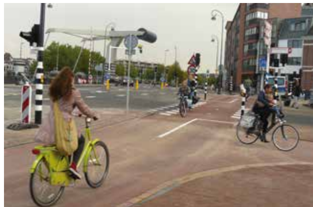
maar zo: Turfmarkt, oktober 2013

Met zijn aftreden zagen de ambtenaren (gesteund door de verkeerspolitie) hun kans schoon ook de zebra weg te poetsen. De veiligste fietser is een fietser die moet afstappen. De zebra zou de fietser wel eens op de gedachte kunnen brengen dat hij voorrang heeft. Gevaarlijk!!! Hoezo afspraken, hoezo Haarlem fietsstad?