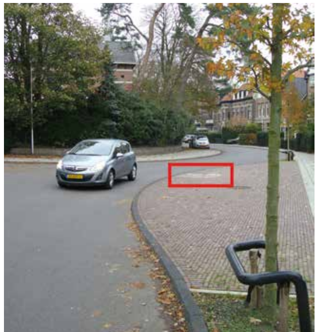
Slachtoffer op Bloemendaalse'slinger'weg