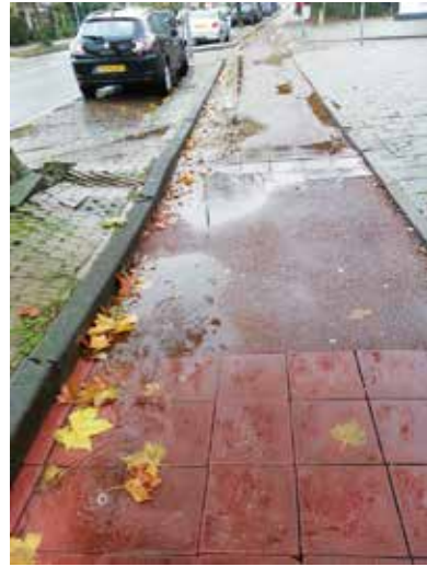
Rijksstraatweg, zakkende tegels, hobbels, plassen, Foto: René Rood

dan was dat prima. Maar het is niet goed gedaan: het asfalt scheurt al weer omdat er toch wortels van opzij onder het asfalt doorgroeien.