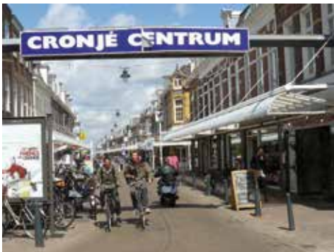
Cronjéstraat anno 2013, overdag autovrij