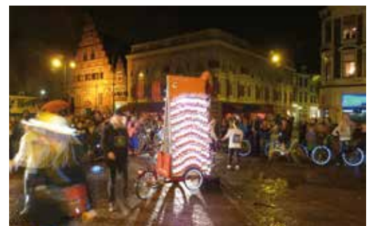
Dansvoorstelling 'licht op die fiets'