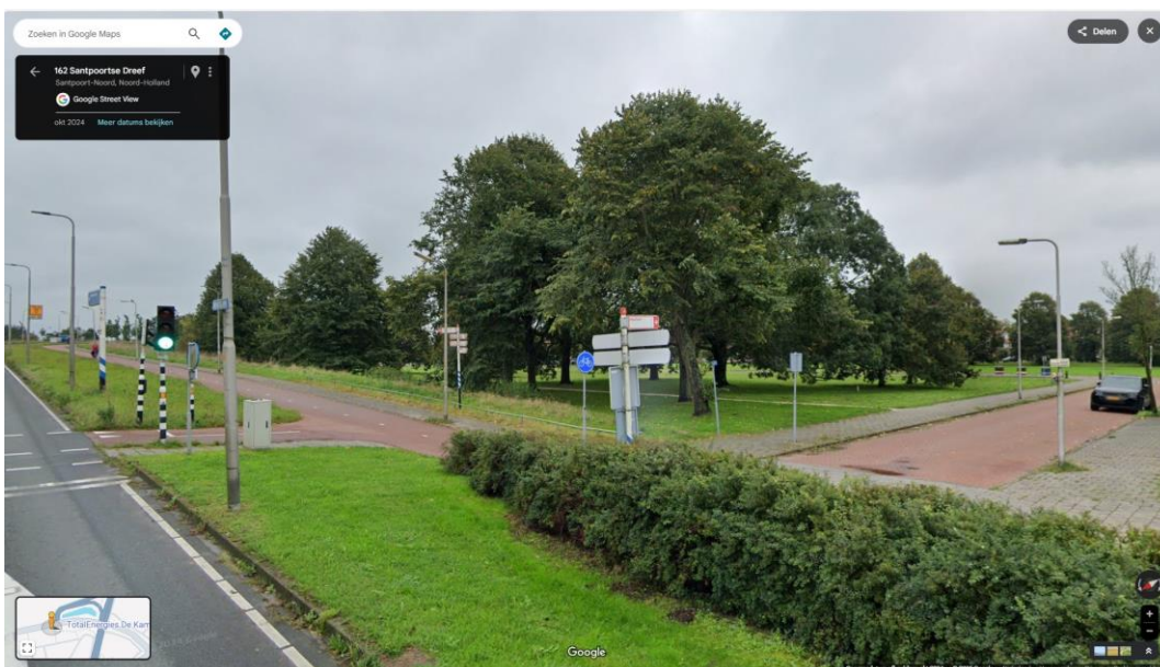
Foto: Santpoortsedreef startpunt bewegwijzerde fietsroute naar Haarlem