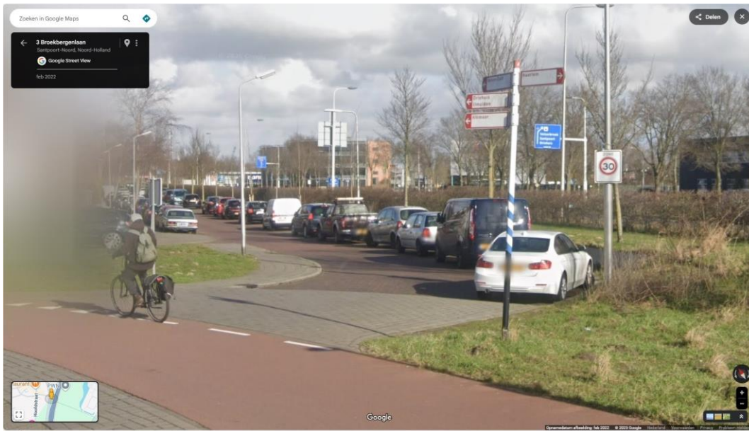
Foto: Startpunt bewegwijzerde fietsroute via Rijksweg naar Velsen-Zuid.