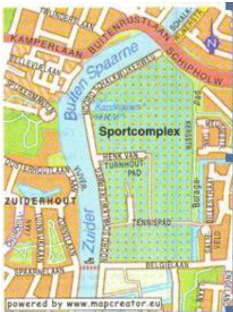
De locatie van het fietserpontje, dat tussen de Belgiëlaan en de Spaarnelaan moet gaan varen. De gemeente hoopt dat het pontje vanaf 2011 in de vaart komt.

De gemeente studeert nog op de onderhouds- en personeelskosten, die op tienduizend euro per jaar worden geschat. Mogelijk dat afvalverwerker Spaarland het pontje gaat exploiteren. De provincie betaalt het merendeel van de realisatiekosten van twee ton. Ondanks de vertragung - het pontje had eigenlijk al in 2009 moeten varen - loopt die subsidie geen gevaar, aldus een provinciewoordvoerder. Informatiebijeenkomst: vanaf 19.30 uur, Oosterhoutlaan 19.