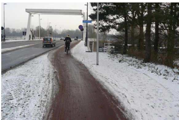
Schouwbroekerbrug – hier komt Haarlemse borsteldienst