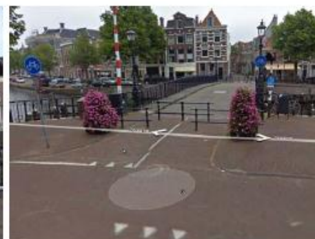
Melkbrug 2008 met de schapenhekjes.

Fietsersbond afdeling Haarlem e.o. • www.fietsersbond.nl/haarlem • e-mail: wg-haarlem@fietsersbond.nl • 1 van 2