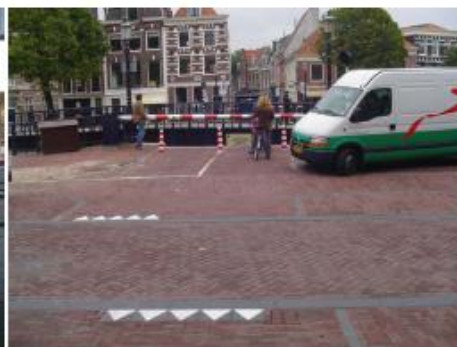
Melkbrug 2005 – situatie net na de reconstructie van het Spaarne: 1 paal in het midden, 2 aan de zijkanten