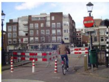
Melkbrug 2006 (vanuit Hoogstraat) – situatie tijdens de problemen met de brug; zigzaghekken op de brug om het fietsverkeer te doseren. Hierna zijn de hekjes geplaatst.