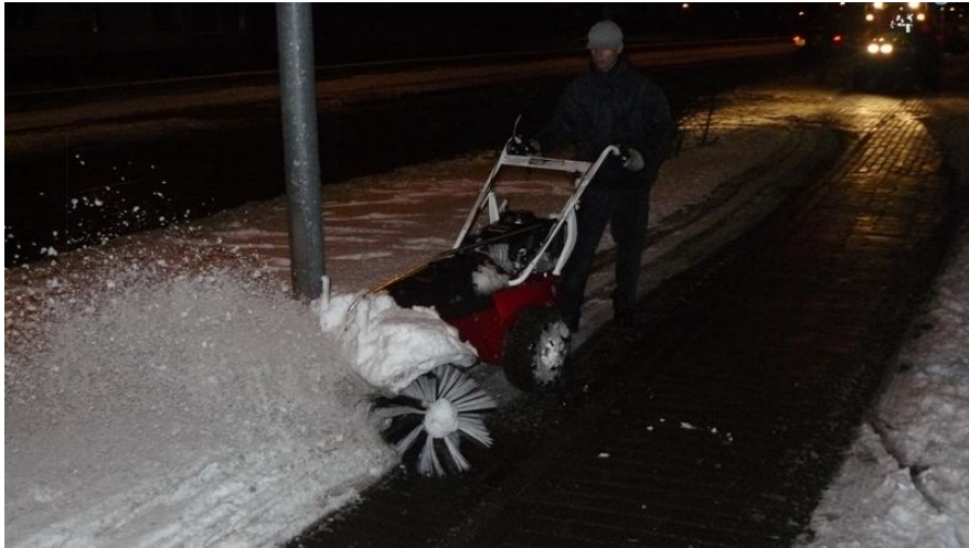
Zaterdagavond – Kleine borstelmachine in actie op de Leidsevaart Haarlem