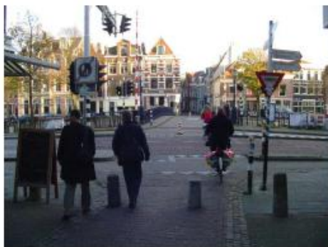
Melkbrug 2004 (vanuit Korte Veerstraat) – situatie van voor reconstructie Spaarne: 1 paal in midden van de brug

Waarom toch die hekjes? Hekjes zijn gevaarlijk en horen niet op een fietspad. Je pest er juist de minder behendige fietsers mee, zoals kinderen en ouderen; ouders met bakfietsen en gehandicapten. Hekjes en paaltjes op fietspaden zijn soms bloedlink voor fietsers. Jaarlijks belanden hierdoor in Nederland 325 fietsers in het ziekenhuis en melden zich 3000 fietsers bij de eerste hulp.