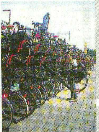
Fietsen bij station Heemstede.

Fietsen die niet goed gerepareerd staan worden meegenomen naar de milieustraat van de