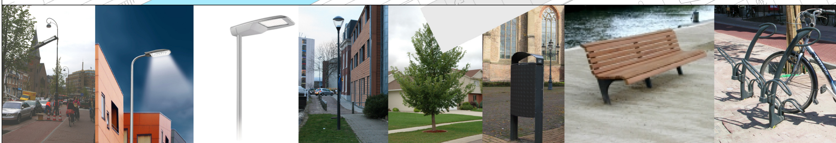
lichtmast Sp, type Spaarne lichtmast A, type Aresa lichtmast S, type Speedstar lichtmast K, type Kio Ulmus 'New Horizon' afvalbak bank fietsenrekken