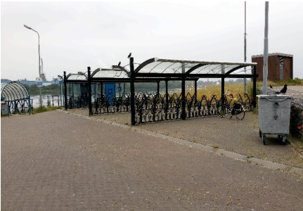
Stalling zoekt fietsen in IJmuiden