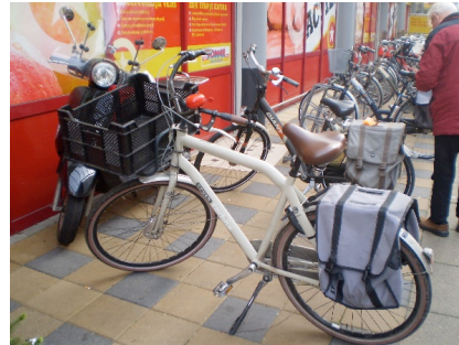
Fietsparkeren in Velsersbroek...