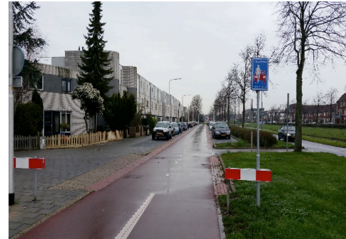
Fietsstraat Waterlelie Velsersbroek