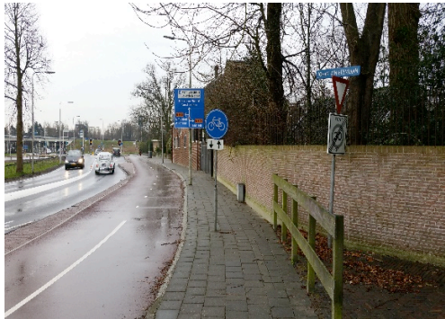
Twee-richtingen op Hoofdstraat Santpoort Noord