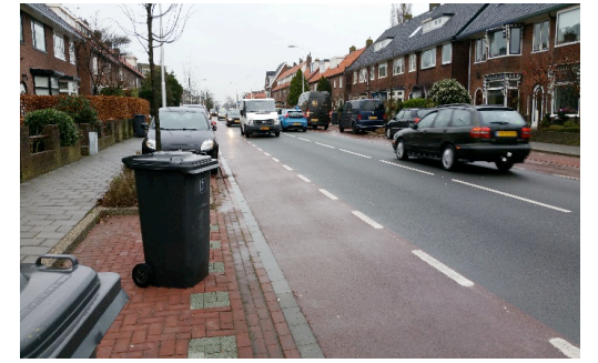
Broekbergenlaan Santpoort-Noord: Fiets in de knel