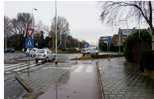
Rotonde Dreef Santpoort