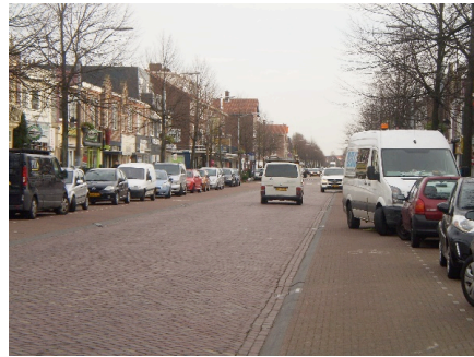
Auto's op fietspad Kennemerlaan IJmuiden