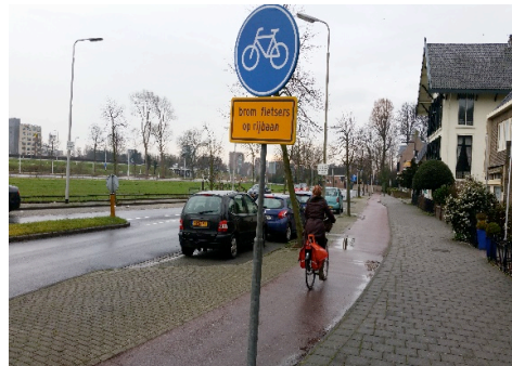
Fietspad is echt voor de fiets