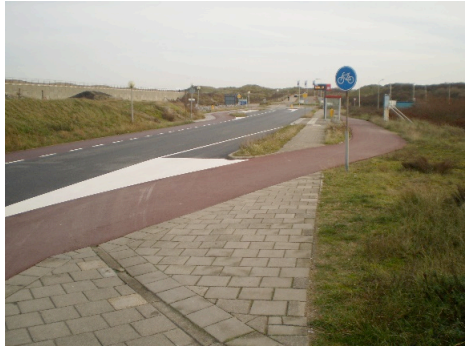
Verbeterd fietspad Kennemerstrand