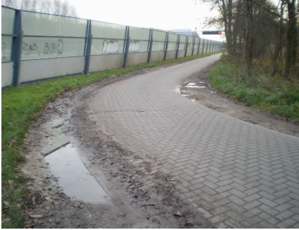
Gevaar! Fietspad bij A9 Locatie?