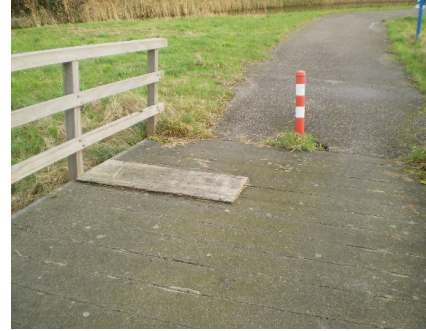
Slecht onderhoud Spaarnwoude Boterdijkweg