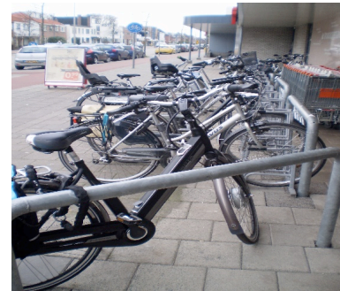
Fietsparkeren bij HOV o.a. in Santpoort