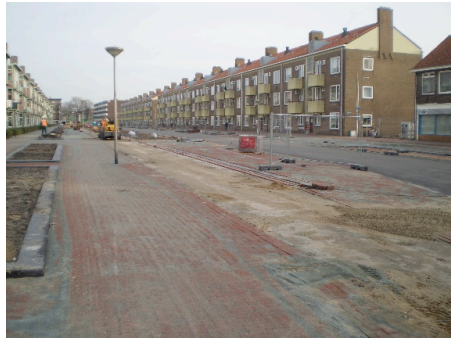
Fiets met HOV Planetenlaan IJmuiden