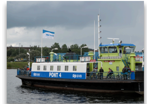
Vaker ponten naar Velsen-Noord