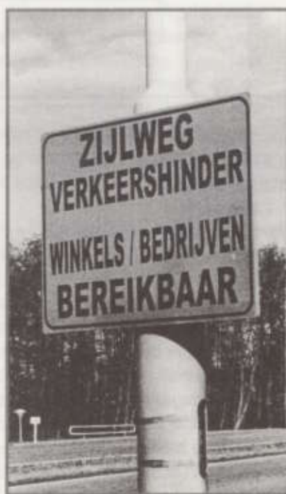
Inderdaad verkeershinder, maar waarom zetten ze die borden nu pas neer? Dat is al jaren zo!

Nou vraag ik me af wat die automobilisten, die dat 'infarct' zelf veroorzaken (ook bij zichzelf) moeten in de binnenstad. En het antwoord wordt steeds duidelijker, ze hebben er niets te zoeken, althans niet met de auto. Je ziet de files al korter worden, dus het schijnt te kunnen. De gemeente speelt een fantastisch ontmoedigingsbeleid. Het begon enige tijd terug toen er heel lang gedaan werd over een rotonde bij de Verspronckweg. Een alternatieve route was de Zijlweg. En nu is, naast veel andere werkzaamheden, de Zijlweg