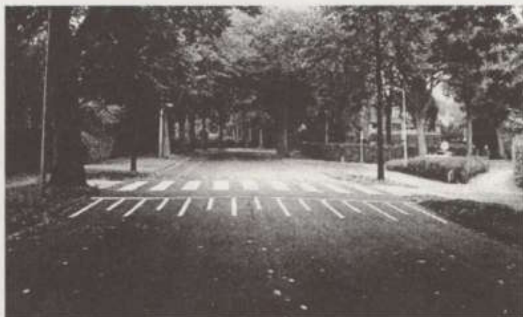
Burg. Den Texlaan, Aerdenhout

Tot slot: wilt u meedoen met een van onze activiteiten bel Frans de Vilder 0255-534253 of mail velsen@fietsersbond.nl .