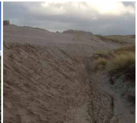
Juli 2016 werd het fietspad zandvrij gemaakt.

http://www.3dmakerszone.com/lopendeduinen/#newsletter