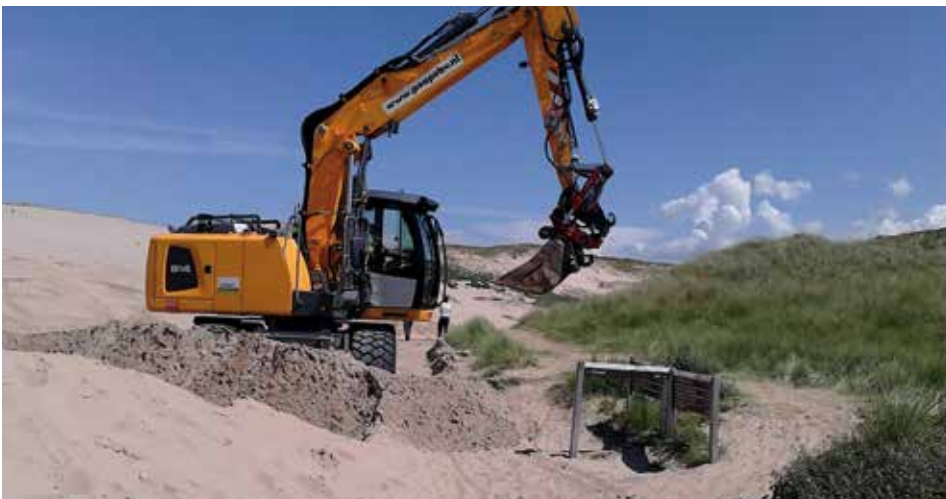
Juli 2016 werd het fietspad zandvrij gemaakt.

In het kader van dit project, Noordwest Natuurkern, zijn indertijd afspraken gemaakt door de wethouder van Bloemendaal, PWN en de toenmalige gedeputeerde Meerhof om het fietspad te behouden, maar PWN lobbyt nu voor het opheffen van het fietspad en verwaarloost het onderhoud. Na de zomerstorm van 2015, waarbij het fietspad werd ondergestoven, duurde het tot juli 2016 voordat PWN, op aandringen van de Fietzersbond, het fietspad zandvrij maakte.