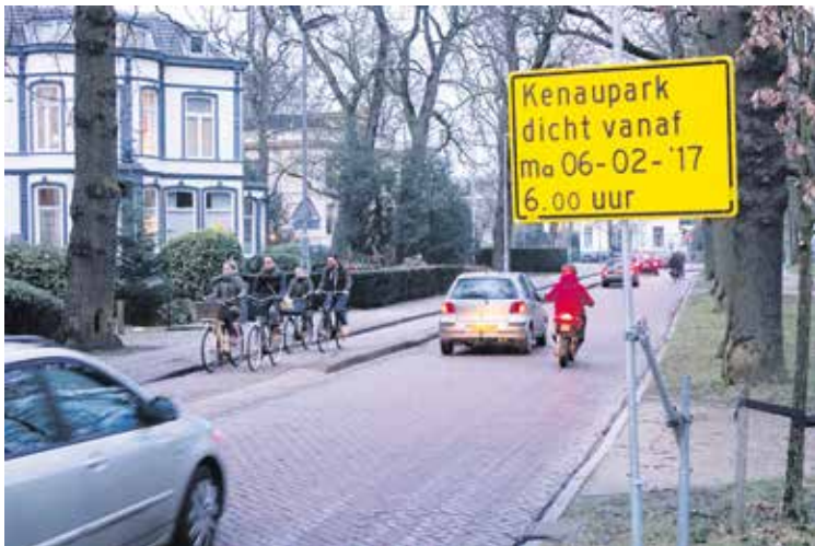
Foto links: De weg, inclusief fietspad en fietsstrook, wordt 2 meter smaller ten behoeve van een extra strookje gras.

Op 9 maart heeft de bezwarencommissie onze bezwaren verworpen (zie de voorpagina van dit magazine en onze site). Tegen deze uitspraak staat beroep open bij de bestuursrechter van de Rechtbank Haarlem.