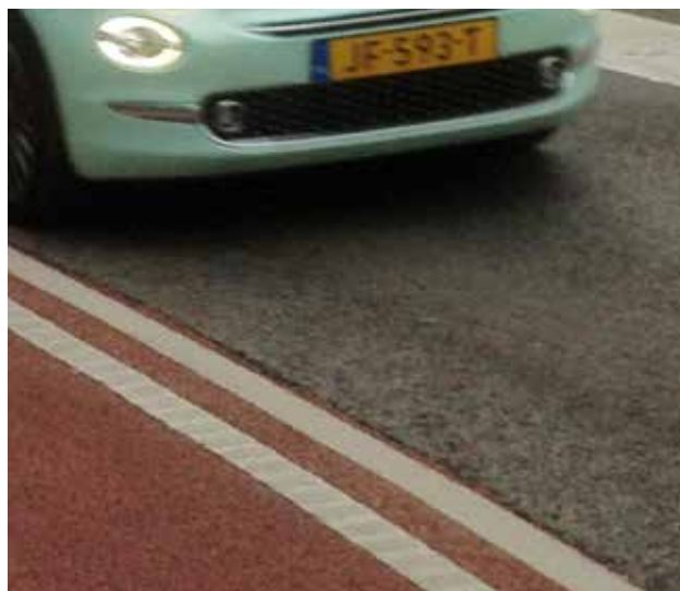
Dubbele witte lijnen met ribbels.

De Fietsersbond heeft een breedte van 1.70 m voorgesteld, de minimale maat waarbij twee fietsers nog naast elkaar kunnen rijden. Het grijze asfalt is dan circa 3.00 m breed waardoor auto's achter fietsers moeten blijven als er een tegenligger nadert. Halverwege de Meerweg liggen twee flauwe bochten waar fietsers regelmatig "bedreigd" worden door afsnijdend en inhalend gemotoriseerd verkeer. Ons voorstel aan de gemeente is om de fietsers te beschermen door langs de fietstrook, een dubbele witte belijning aan te brengen voorzien van hinderlijke ribbels. Die moeten er voor zorgen dat de automobilisten in de bochten niet over de fietstrook rijden. Verder moet het grijze asfalt in de bochten zo breed zijn dat tegenliggers elkaar in die bochten kunnen passeren. Veel meer is binnen de beperkte ruimte niet mogelijk.