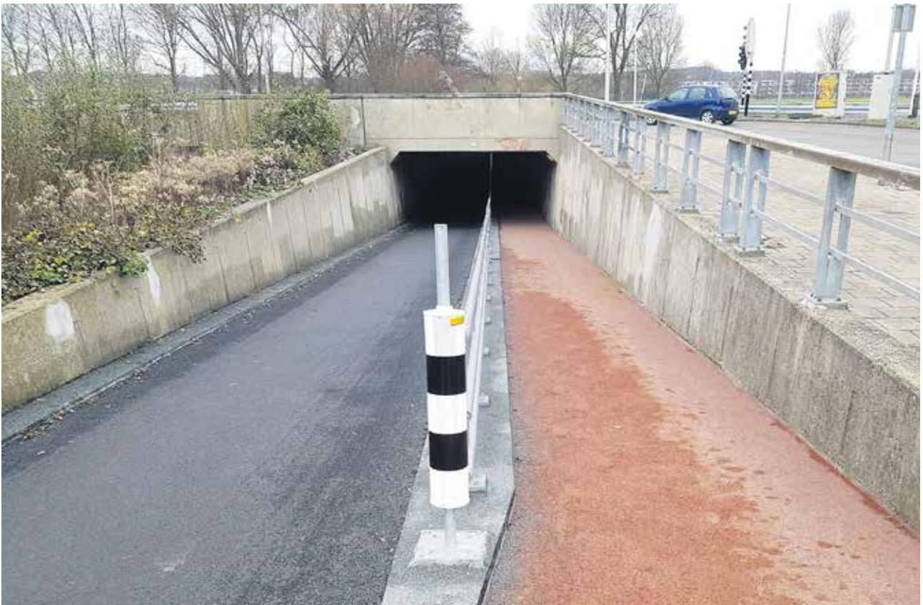
Tunneltje Westelijke randweg: links het fietspad in donkergrijs asfalt, rechts het voetpad in rood asfalt.

Hopelijk wordt het tunneltje daarvoor niet weer onnodig lang afgesloten.