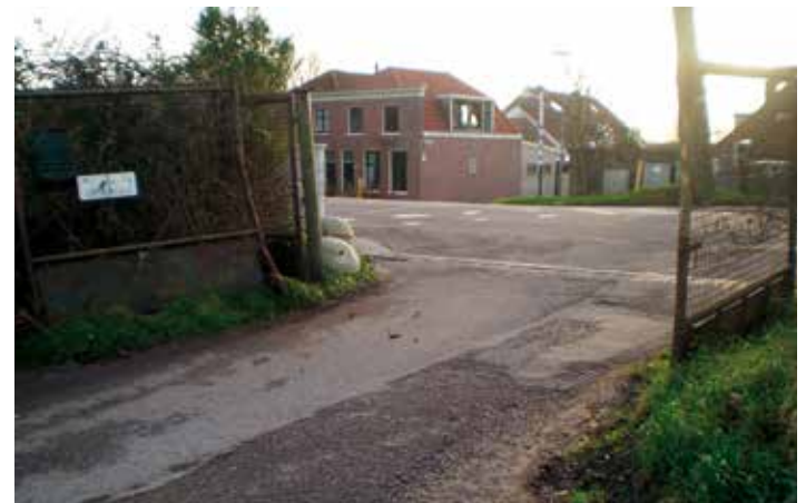
Op de foto's: toegangswegen recreatiegebied Spaarnwoude.

http://www.duurzaamspaanwoude.nl/beeldkwaliteit