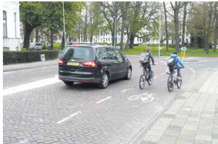
Foto rechts: Kinderhuisvest/hoek Kenapark: Fietsers die rechtdoor gaan, moeten de automobilisten straks voorrang verlenen.