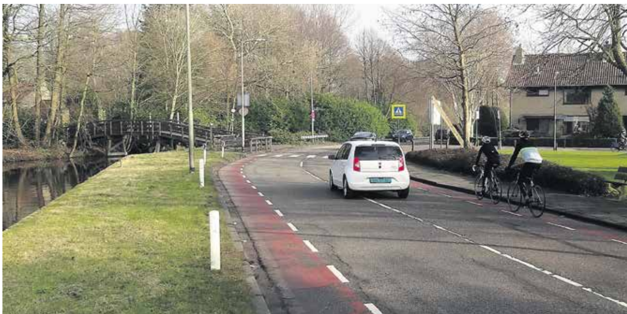
Een van de bochten in de Meerweg.