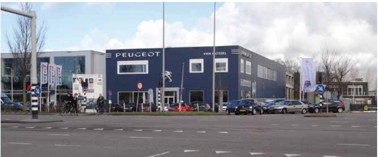
Heemstede: Cruquiusweg kruising HBC.

Gedacht wordt aan een extra ontsluitingsmogelijkheid op de Cruquiusweg ter hoogte van de Nijverheidsweg. Er is inmiddels een plan van aanpak opgesteld waarbij de Fietsersbond betrokken wordt.