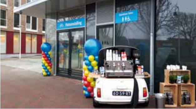
Feestelijke opening op 19 december 2016.

In het centrum van Zandvoort, in de Louis Davidsstraat, is naast het busstation bij Albert Heijn een nieuwe inpandige fietsenstalling geopend. Er is cameratoezicht. De stalling is vooral bedoeld voor busreizigers en bezoekers van het centrum. Hij is vanaf 06:00 uur gratis toegankelijk en te openen met je OV-chipkaart. Er is plaats voor circa 100 fietsen in 2-etagerekken waarvan een deel geschikt is voor fietsen met kratjes.