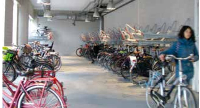
Ruimte genoeg voor je fiets..

Daarnaast is er ruimte gereserveerd voor het parkeren van bakfietsen. De gemeente verwacht dat hiermee het aantal hinderlijk en 'te pas en te onpas' in de openbare ruimte geparkeerde fietsen, zal afnemen. De fietsenstalling is mede mogelijk gemaakt door een bijdrage van de provincie Noord-Holland. De gemeente Zandvoort toont zich opnieuw van haar fietsvriendelijke kant.