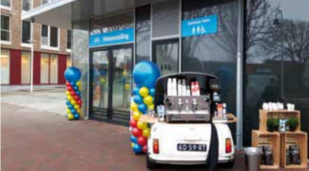
Feestelijke opening op 19 december 2016.

In het centrum van Zandvoort, in de Louis Davidsstraat, is naast het busstation bij Albert Heijn een nieuwe inpandige fietsenstalling geopend. Er is cameratoezicht. De stalling is vooral bedoeld voor busreizigers en bezoekers van het centrum. Hij is vanaf 06:00 uur gratis toegankelijk en te openen met je OV-chipkaart. Er is plaats voor circa 100 fietsen in 2-etagerekken waarvan een deel geschikt is voor fietsen met kratjes.