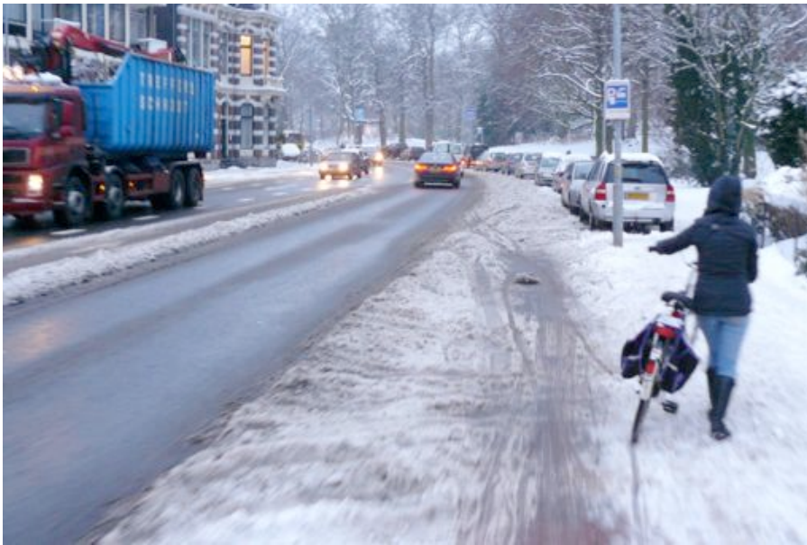
Fietsstrook vol sneeuw op het Staten Bolwerk – de weg op, of met de fiets aan de hand over de stoep - foto Jaap Moerman

“Misschien is het beter dan vorig jaar, maar het lijkt me vroeg om teveel de loftrumpet te steken, hou ze scherp!”