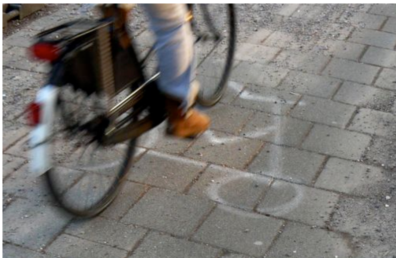
Handgetekend fietssymbool bij werkzaamheden Herenweg Heemstede

Eindelijk wordt de flessenhals van de Glipperweg (tussen Prinsenlaan en Kempphaanlaan) verbeterd voor fietsers. Leerlingen van Atheneum College Hageveld hadden dit als knelpunt aangegeven tijdens hun Maatschappelijke Stage bij de Fietsersbond. We zijn zeer verheugd dat er fietssuggestiestroken van 1,25m breed in rood asfalt komen en dat er dan geen middenstreep meer is voor het autoverkeer. Het rode asfalt noopt automobilisten langzamer te rijden omdat ze de smalle rijbaan moeten delen met de tegenligger die ze door de bocht pas laat kunnen zien.