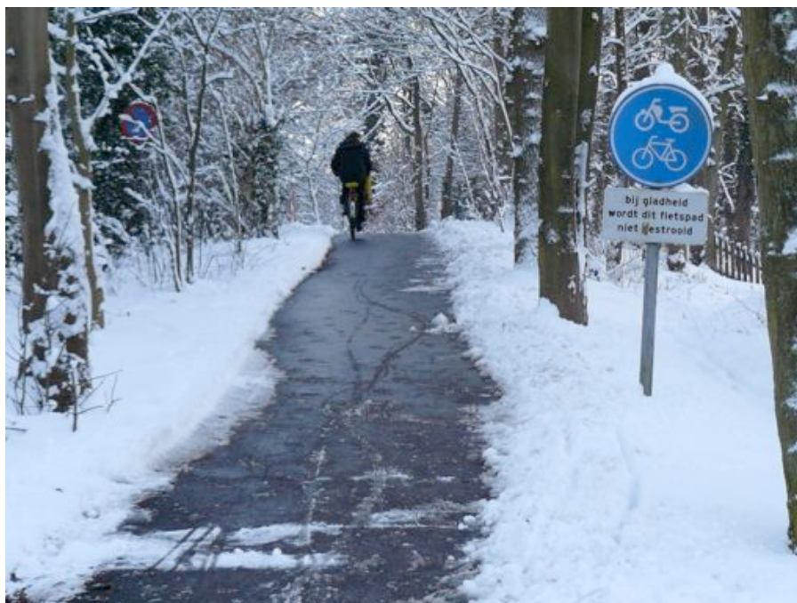
Foutje, het fietspad is wel geveegd! Elswoutlaan 18 december, de dag na de 'grote sneeuwval'.