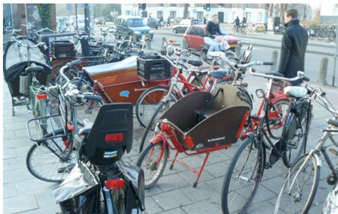
Gezocht: parkeerplek voor bakfietsen Kennemerplein maart'11