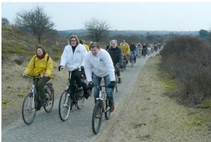
Fietstocht Kattendel 13-2-2011