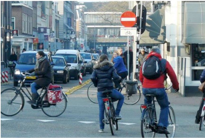
Fietsers mogen nu ook richting noord door de Kruisweg - foto Jaap Moerman

citeit beperken. Maar wat is een weesfiets? Weesfietsen detecteer je niet zo maar. Daar is een detectiesysteem voor nodig. En wanneer is een fiets 'verweest'? In een grote kelder is het handig om een gestalde fiets terug te vinden. Een verwijzingsstelsel is nog niet voorhanden.