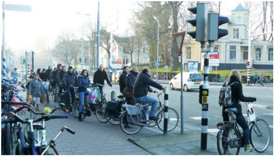
Fietsfile voor Kennemerbrug richting Haarlem-Noord

Nu met de herinrichting van het Stationsplein blijkt dat als men vanaf de oostkant (Spaarne) de nieuwe stalling in wil men een behoorlijke omweg moet maken. De praktijk situatie is dat zo iets ca. 5 min. extra kost. Voor forensen is dat geen goede zaak en zeker niet klantvriendelijk. In mijn ogen is het ook erg vreemd dat men aan de oostkant ook geen fietsen op/afgang heeft geprojecteerd.