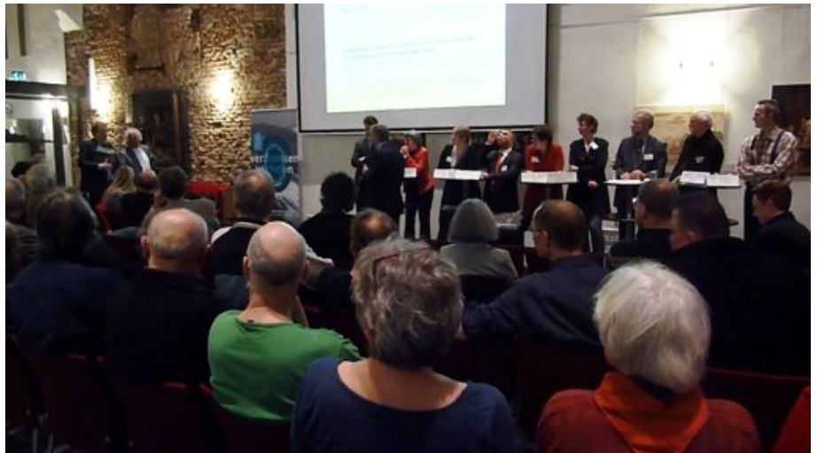
Statendebat: het gaat er geanimeerd aan toe