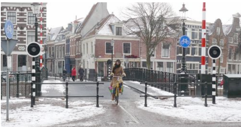
Melkbrug december: Waarom is de brug niet 1 meter breed?