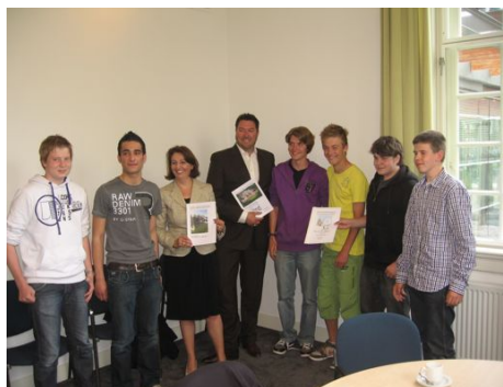
Weet u het nog: deze leerlingen hebben hun stage bij de afdeling gedaan

De omgeving van het NS-station ziet er tegenwoordig een stuk beter uit. Sommigen zijn echter minder blij omdat hun fiets — volgens hen — onterecht is verwijderd. Wij willen graag een goed beeld krijgen van de positieve en negatieve aspecten. Laat het ons weten.