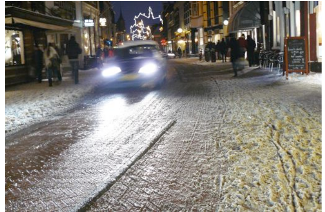
Het varkensruggetje is slecht zichtbaar tussen de sneeuwdrab en het tegenlicht van de auto's