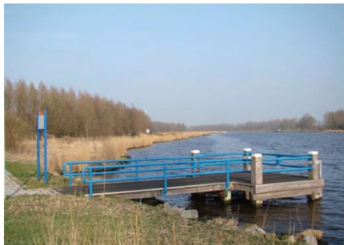
Het pontje bij Spaarnwoude