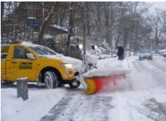
Fietspaden moet je borstelen