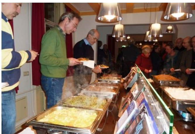
Etentje voorafgaand aan het Statendebat

De belangrijkste resultaten? Alle partijen vinden een goed fietsnetwerk en goede fietsvoorzieningen belangrijk, bijvoorbeeld vanwege de bereikbaarheid, de overstap op OV en recreatie. Alle deelnemende partijen willen ook voortzetting van Impuls