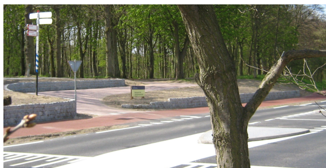
nieuwe oversteek Heerenduinen FdV

Dit voorjaar kregen wij een uitnodiging van het Recreatieschap Spaarnwoude om voorgelicht te worden over de zogenoemde CRM-tunnel. Al 36 jaar ligt hier ongebruikt een fietstunnel onder de A9, kosten indertijd meer