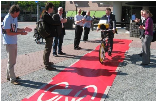
Wethouder opent praktijkmeeting Hoofddorp

Niet standaard worden de fietsroutes tussen verschillende kernen mee genomen in het Fietsbalans onderzoek. Dat speelt vooral in de Haarlemmermeer. De Fietsersbond heeft nu een opzet gemaakt waarbij iedereen zijn (dagelijkse) fietsroute kan beoordelen. Je kunt dit melden via de website van de Fietsersbond. De resultaten zullen mogelijk worden betrokken bij de onderzoeksrapportage. Hierover hebben de leden in de Haarlemmermeer onlangs een rechtstreeks schrijven gehad.