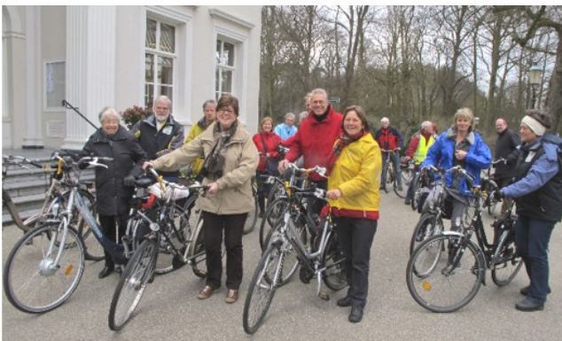
Vertrek bij het gemeentehuis van Bloemendaal

Het was koud op 31 maart 2010, er stond veel wind en er was onweer voorspeld. Toch kwamen er 227 mensen naar de Veerplas om de opening van het fietsknooppuntennetwerk van de regio Kennemerland Zuid mee te maken en tegelijkertijd mee te tellen voor de recordpoging van de Fietzersbond en het NISB (Nederlands Instituut voor Sport en Bewegen). Vanuit verschillende gemeenten in de regio vertrok een stoet fietsers richting Veerplas, waar iedereen een gratis knooppuntenkaart kreeg en een lunch, die werd aangeboden door Frumona en bakkerij Van Vessem.