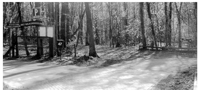
AWD duinrandtracé

Het tracé zal lopen langs de rand van het gebied, parallel met een nieuw te plaatsen damhertkerend hekwerk. Dan blijven de herten binnen en fietsers buiten het wandeldomein.