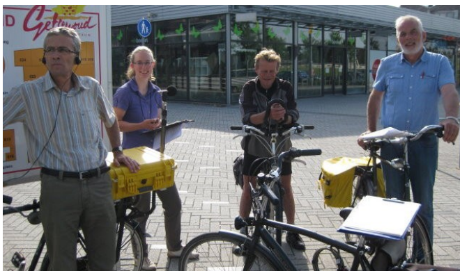
Het fietsteam in Nieuw Vennep

Op 22 juni was het de beurt aan Nieuw-Vennep. De voorbereidingen van de routes (ongeveer 30 km) voor