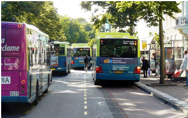
Busstation Parklaan

Maar er is meer. De bussen zijn verplaatst van het Stationsplein naar de Parklaan en de Kruisweg. Voor de Zuidtangente is op de Parklaan een keerlus gemaakt; de bushaltes van alle andere bussen zijn terecht gekomen op de fietsstroken van de Parklaan en op de Kruisweg. Dit plan van de gemeente leidt tot onveilige situaties. De fietsers moeten laveren tussen bussen en auto's, tussen stilstaande en dus ook optrekkende bussen rechts van hen en voorbijrazend autoverkeer aan hun linkerzijde.