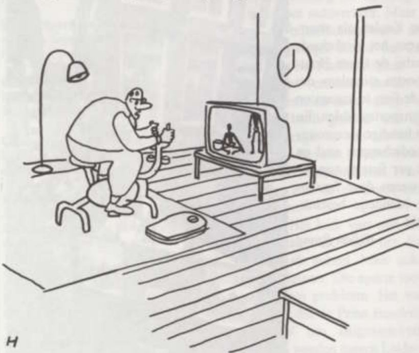
tekening Hans van Pelt

Begin augustus maakte de gemeente bekend dat nog dit jaar gestart zou worden met zes maatregelen om het fietsen in Schalkwijk aantrekkelijker te maken. Dat kan dankzij 388.500 euro subsidiegeld voor 2004. Het gaat om een scheiding voor fietsvoorzieningen op de Boerhaavelaan-west, Groningenlaan en Zuiderzeelaan. Op de Briandlaan komt een scheiding van de fietsstrook; op het gevaarlijke kruispunt Briandlaan/Stresemannlaan komen 'middengeleiders'. De