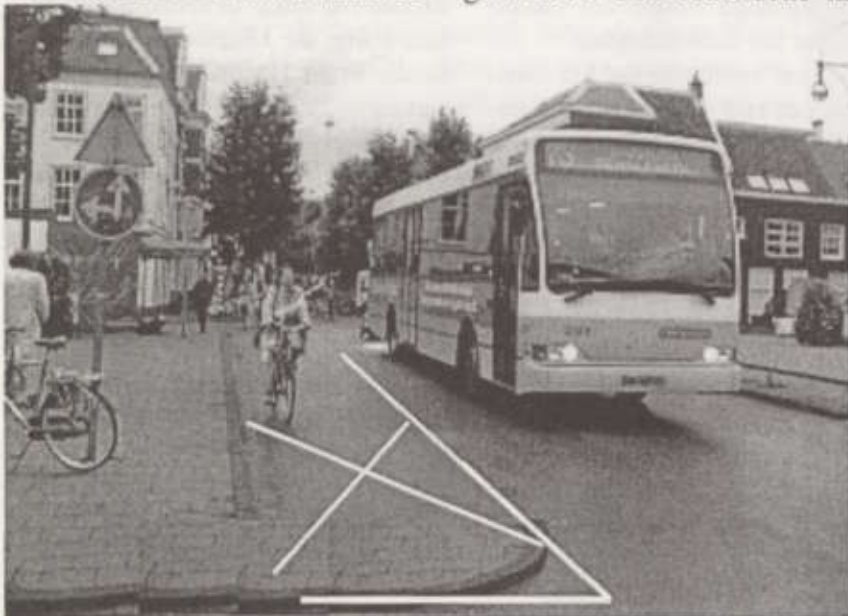
het oorspronkelijke plan

De Fietsersbond was bang dat fietsers door de versmalling op de brug zouden worden klem gereden en dat inhaalmanoeuvres over de fietsstrook zouden plaatsvinden. De Fietsersbond stelde dat door een apart fietspad te maken twee vliegen in één klap geslagen kunnen worden. De fietser rijdt veilig en inhaalgedrag op de Houtbrug zou zo goed als onmo-