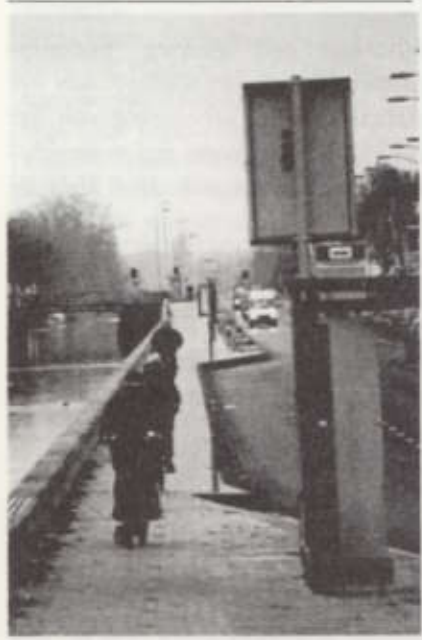
Het is even dringen op het smalste stuk van het nieuwe fietspad langs de Leidsevaart

Op 27 november 2002 heeft wethouder Jur Visser de Zijlweg officieel geopend. De Fietsersbond was hierbij om het glas te heffen, want we zijn blij met het resultaat: comfortabele fietspaden en een ongehinderde doorgang. Een verademing