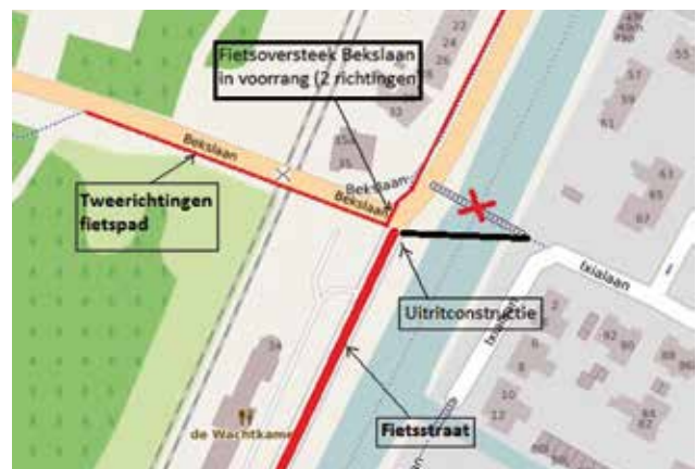
Zo zou het moeten worden.

De gemeente Bloemendaal heeft de kruising Bekslaan-Leidsevaart op de planning gezet voor 2019. Dan wordt dus sowieso begonnen met de herinrichting, met of zonder subsidie.