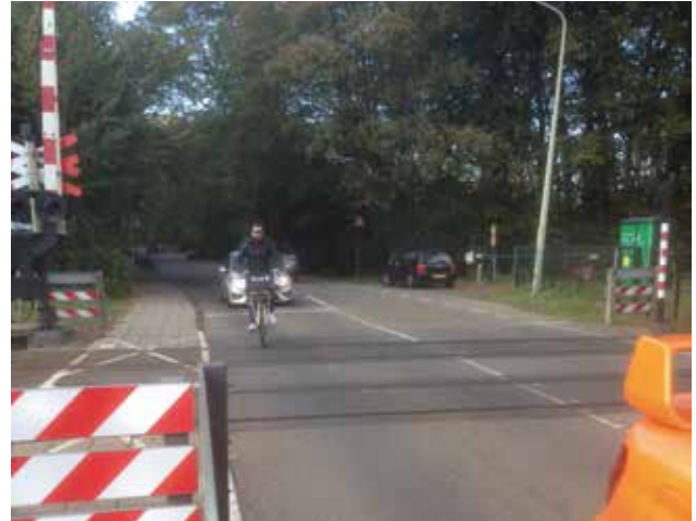
Fietsers laveren op rijbaan tussen de auto's door.

Het grootste probleem vormt het doortrekken van het tweerichtingenfietspad over de spoorweg. Fietsers moeten nu aan beide zijden op de rijbaan, tussen de auto's door, de spoorweg oversteken (foto onder). Dit leidt regelmatig tot (bijna)ongevallen.