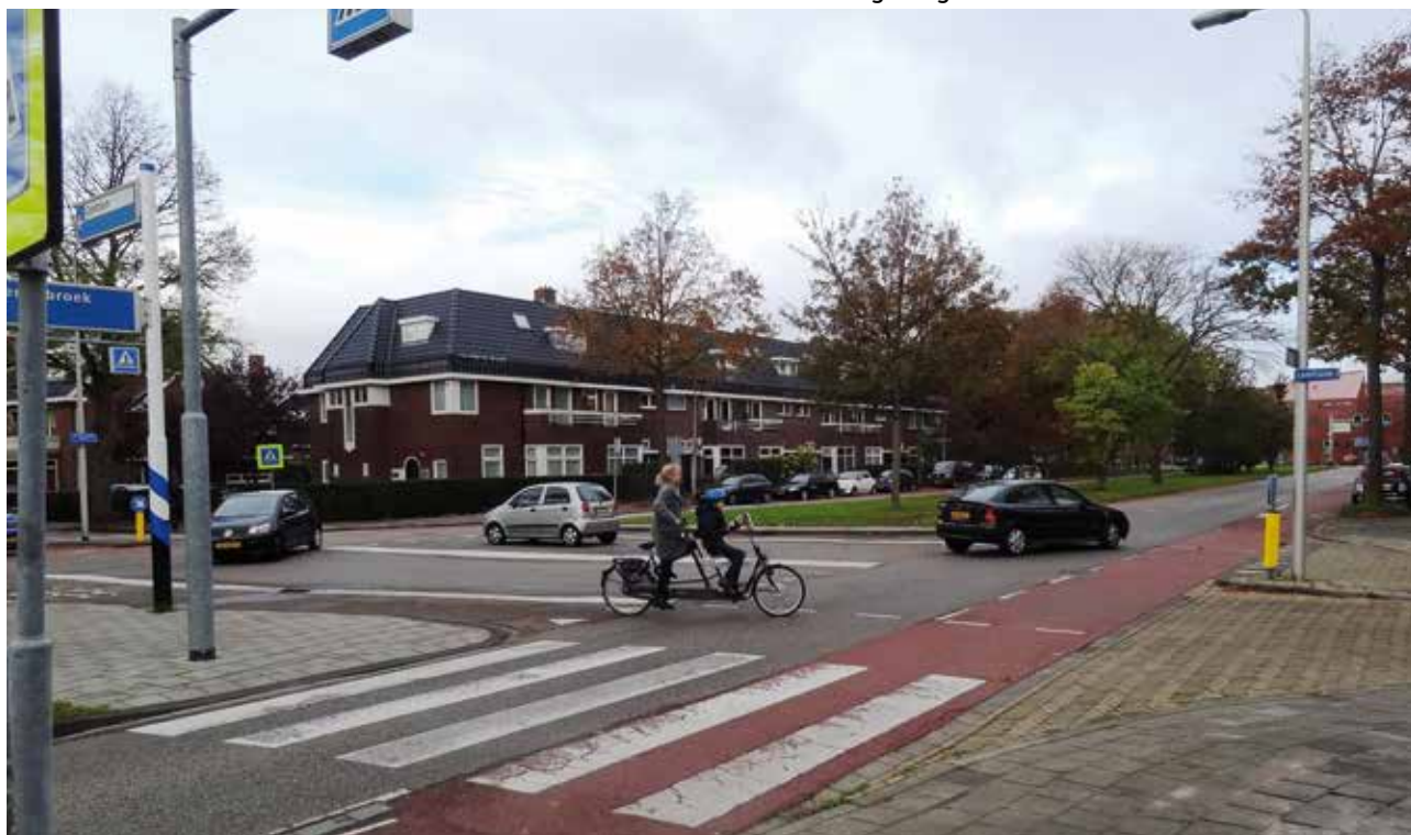
De Heemstedse Dreef ter hoogte van de kruising met de Camplaan, gezien in noordelijke richting.

Op 25 september jl. werden tijdens een bijeenkomst in het gemeentehuis de resultaten van het onderzoek gepresenteerd. De aanwezigen spraken geen duidelijke voorkeur uit. Die kon men na afloop van de bijeenkomst aangeven op een enquêteformulier. De meerderheid was wel van mening dat de inrichting vooral gericht moet zijn op inperking van de snelheid van het verkeer, omdat vooral dát de veiligheid ten goede zal komen. Verontruste bewoners van aanliggende buurten spraken de vrees uit dat het verkeer dan op zoek zal gaan naar alternatieve routes. Het is dus zaak nog te kijken naar de gevolgen van de te kiezen maatregelen voor de omgeving.