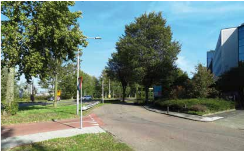
Amsterdamsevaart: fietsoversteek over de Prins Bernardlaan (links op de foto).

Inmiddels ligt er een ontwerp voor een fietsstraat. Er is gekozen voor deze vorm, omdat autoverkeer mogelijk moet blijven. Om dit autoverkeer te ontmoedigen is gekozen voor een rode geasfalteerde loper van 3,5 meter met aan beide zijden een rabatstrook van gebakken klinkers van 0,6 meter. Dit profiel voldoet aan de CROW-normen: er is voldoende ruimte voor de fietser en het dwingt het autoverkeer tot langzaam rijden.