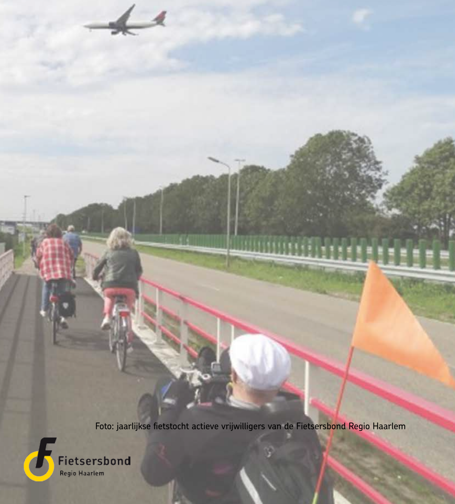
Foto: jaarlijkse fietstocht actieve vrijwilligers van de Fietsersbond Regio Haarlem

Informatieblad van de Fietsersbond Regio Haarlem * jaargang 42 * nummer 3 * december 2018