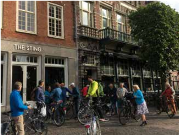
De actieve ledenfietstocht startte dit jaar op de Grote Markt in Haarlem.

Zie voor meer foto's het fotoalbum op onze website: https://goo.gl/dT7Dor