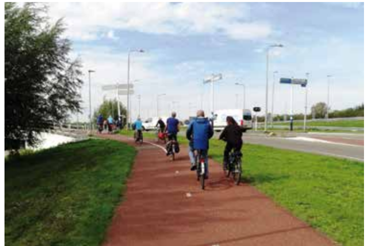
De groep vervolgde zijn weg richting Halfweg via de Regionale Doorfietsroute G200. Na de lunch werd teruggefietst via de F200. Op de foto: de kruising met de Weerenbrug naar Zwanenburg.