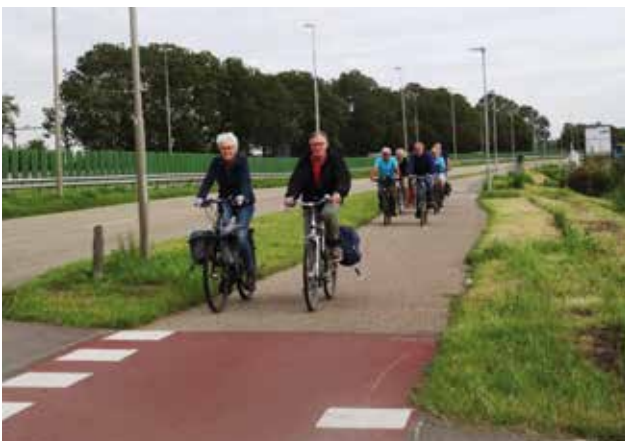
De groep op weg richting Haarlem, vlak voor een kruising met een inrit van een bedrijventerrein.