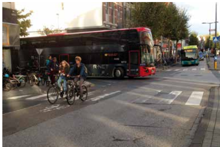
XXL-bus op weg naar Amsterdam: met 356 in drie kwartier naar de ArenA, met 346 in een half uur naar Amsterdam Zuid.

* Vaststelling van het DO is in overleg met de Provincie verschoven naar het eerste kwartaal 2019.