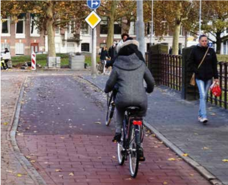
Kennemerbrug: verbreed, maar met rechte trottoirbanden.

De Kennemerbrug had afgelopen zomer urgent groot onderhoud nodig. Bij onderhoudsprojecten wordt het wegprofiel in principe niet gewijzigd, maar omdat het hier een zeer drukke verbinding tussen het centrum, het station en Haarlem-Noord betreft, heeft de gemeente tot onze vreugde besloten de fietspaden toch te verbreden van 1,8 meter naar 2,5 meter.