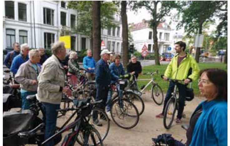
Als eerste werd het vernieuwde, nog niet geheel gereed zijnde, Kenaupark aangedaan.