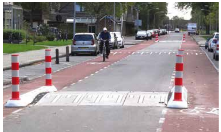
Een extra rondje tussen Parkwijk en de Zuiderpolder naar Schalkwijk bracht de groep via de Engelandlaan (op de foto: inmiddels voorzien van snelheidsremmende maatregelen) en het Spaarne terug naar de stad.