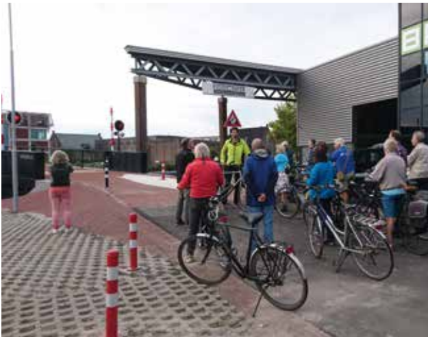
De Figebrug was net op tijd gereed om in de route te worden opgenomen.