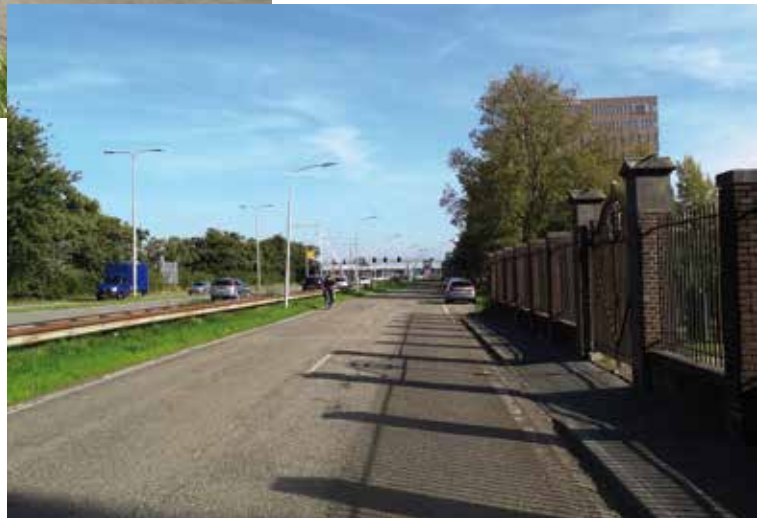
Amsterdamsevaart: bij begraafplaats.

Met dit traject komt voorlopig een einde aan de Haarlemse bijdragen aan de F200. Mogelijk komt er op termijn nog een reconstructie in het gedeelte tussen de Amsterdamse Poort en de Prins Bernardlaan. Daarnaast is het wachten op de uitvoering van verbeteringen op het traject in de gemeente Haarlemmerliede.