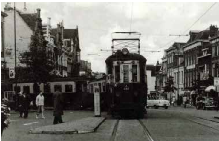
Tot 1957 reed de blauwe tram tussen Amsterdam en Zandvoort en was het Houtplein al een belangrijke halte.