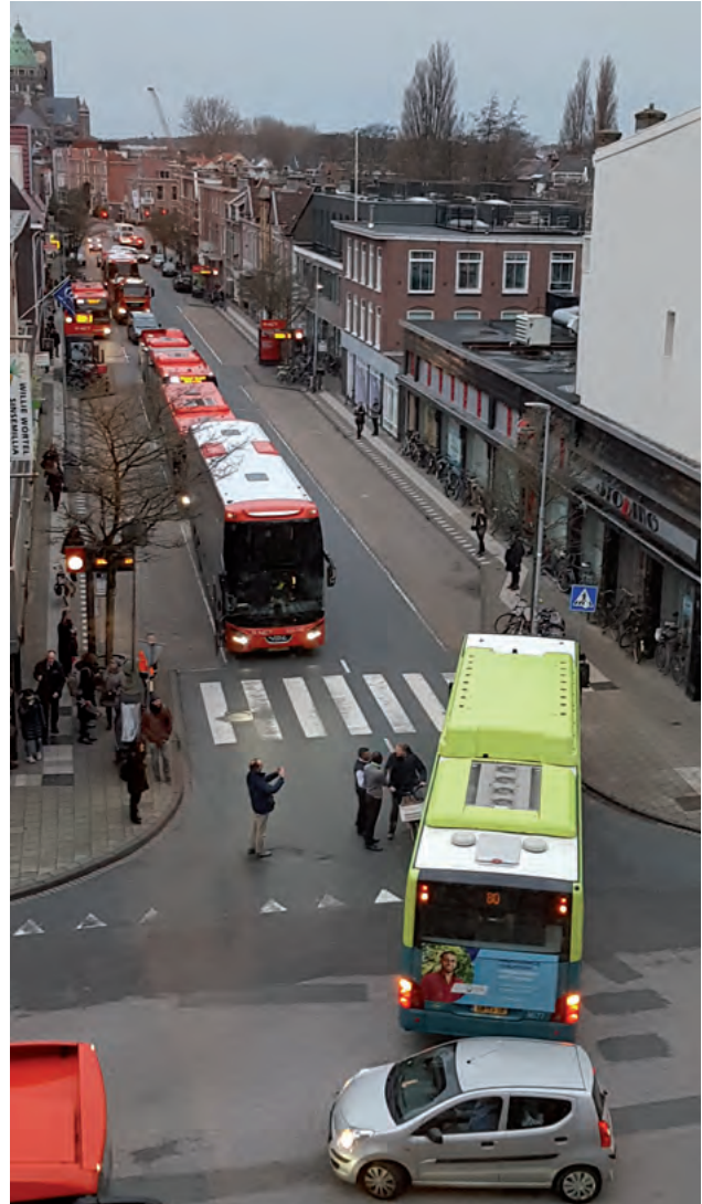
Patstelling zorgt voor grote verkeersopstopping.

De presentaties van de diverse afdelingen binnen onze Regio Haarlem en de overige stukken kunt u lezen op onze website: https://bit.ly/2I2I1Zj .