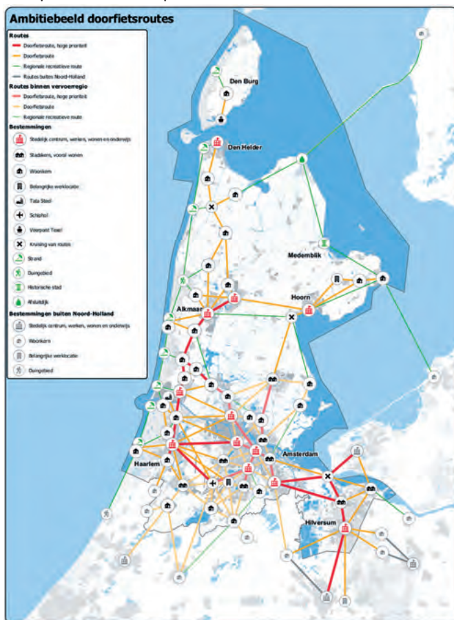
Afbeelding 1: ambitiebeeld doorfietsroutes.

De provincie Noord-Holland heeft de nota 'Perspectief Fiets' vastgesteld, een document waarin uitdagingen en doelen voor de fiets voor de komende jaren zijn vastgelegd. In de nota wordt veel aandacht besteed aan doorfietsroutes. Potentiële routes zijn nog slechts schematisch weergegeven op de kaart in 'Perspectief Fiets' (afbeelding 1: ambitiebeeld doorfietsroutes). Het exacte verloop wordt later in samenwerking met lokale overheden en de Fietsersbond vastgesteld. Uiteraard hopen wij dat de door ons bedachte routes in de regio Haarlem en Haarlemmermeer worden overgenomen op de definitieve provinciale kaart.