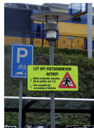
Waarschuwbord bij station Heemstede-Aerdenhout

Fietsendiefstal bestaat al heel lang. Het aantal fietsendiefstallen neemt toe, al zijn daar geen exacte cijfers over. Vorig jaar deden 96.507 mensen aangifte bij de politie, maar hoeveel mensen doen geen aangifte? Schattingen van de Stichting Aanpak Voertuigencriminaliteit gaan uit van 450.000 gestolen fietsen per jaar. Amsterdam is koploper. Haarlem is een goede tweede met 5,8 aangiftes per 1.000 inwoners en Heemstede doet het ook 'goed' met 5 aangiftes per 1.000 inwoners. Bij station Heemstede wordt tegenwoordig met een speciaal bord bij de fietsparkeerplaats gewaarschuwd.