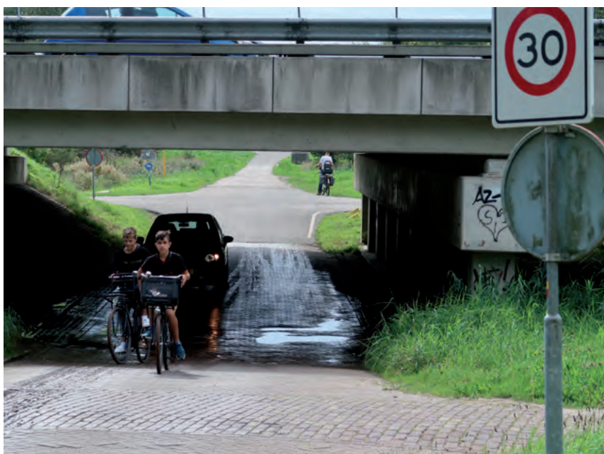
Het natte tunneltje onder de A9: geen last meer van water, nog wel van sluipverkeer!

In Spaarnwoude worden nu regelmatig bruggen en fietspaden opgeknapt. De afwatering van het tunneltje is recent verbeterd! Probleem is dat de wegen en paden in Spaarnwoude vaak in beheer zijn bij een ander overheidsorgaan, zoals RWS of Rijnland. We hopen dat de afdelingen Haarlem en Haarlemmermeer van de Fietsersbond aandacht gaan schenken aan de routes richting Spaarnwoude.