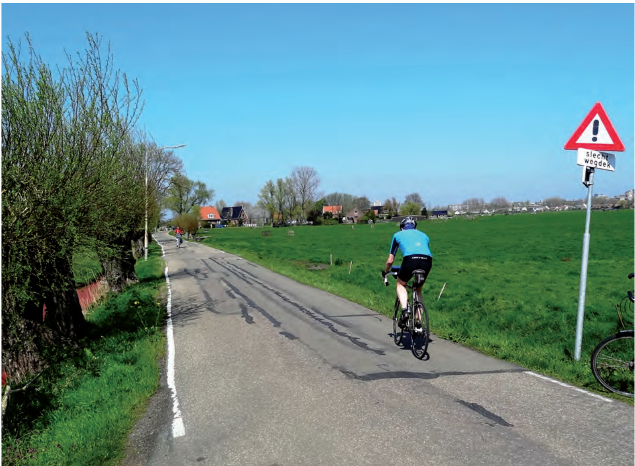
Zuid Schalkwijkerweg aan het begin van het Spaarne.

Door dit alles zal de weg een tijd lang niet gebruikt kunnen worden. De bereikbaarheid van de woningen langs de weg en de toegang voor nood- en hulpdiensten moet tijdens de werkzaamheden gewaarborgd worden. Het zal echter lastig zijn om fietsers op een veilige manier langs het werk te loodsen. Daardoor ziet het er naar uit dat fietsers tijdens de werkzaamheden omgeleid zullen worden, tenzij het mogelijk is een noodpad aan te leggen voor fietsers. Na de werkzaamheden komt er weer een mooie weg beschikbaar.