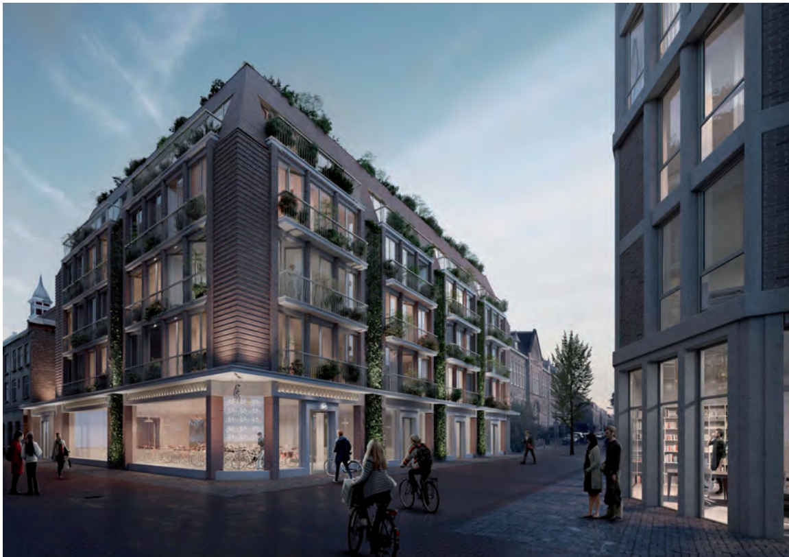
Artist impression van de nieuwe Raaks fietsenstalling. Links is het torentje van de Jopenkerk zichtbaar.

Parkeerdrukgestuurd fietsbeleid is achterhaald. Het is tijd om aan te sturen op een parkeerduurgestuurd beleid. Bij de gemeente Haarlem is "het kwartje nog niet gevallen".