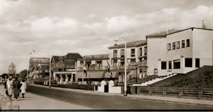
Boulevard Paulus Loot in de negentiendertiger jaren: Links achteraan de oude betonnen watertoren die in 1943 door de Duitsers is opgeblazen.

Eind 2019 wil de gemeente starten met de werkzaamheden aan de Boulevard Paulus Loot, de zuidelijke boulevard.