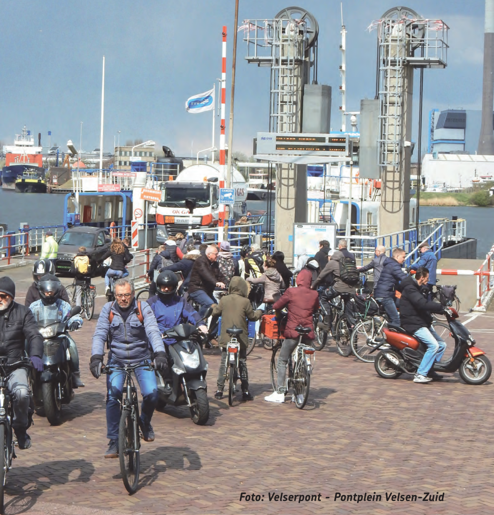
Foto: Velserpont - Pontplein Velsen-Zuid

Informatieblad van de Fietsersbond Regio Haarlem * jaargang 43 * nummer 1 * april 2019