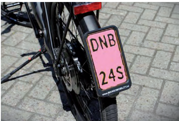
Wordt dit de jongste boreling op de weg of het fietspad??

De speedpedelec is volgens de wetgever een bromfiets. Wij stelden in de motie "Een beetje van jezelf en de rest uit de stekker" voor geen aparte categorie (met roze plaatje??) te bepleiten. Het bestuur wilde eigenlijk wél die kant op. Van de Ledenraad mag de speedpedelec best deel uitmaken van de 'fietsfamilie', maar dan wel als een voertuig met geel plaatje, een brommer dus.