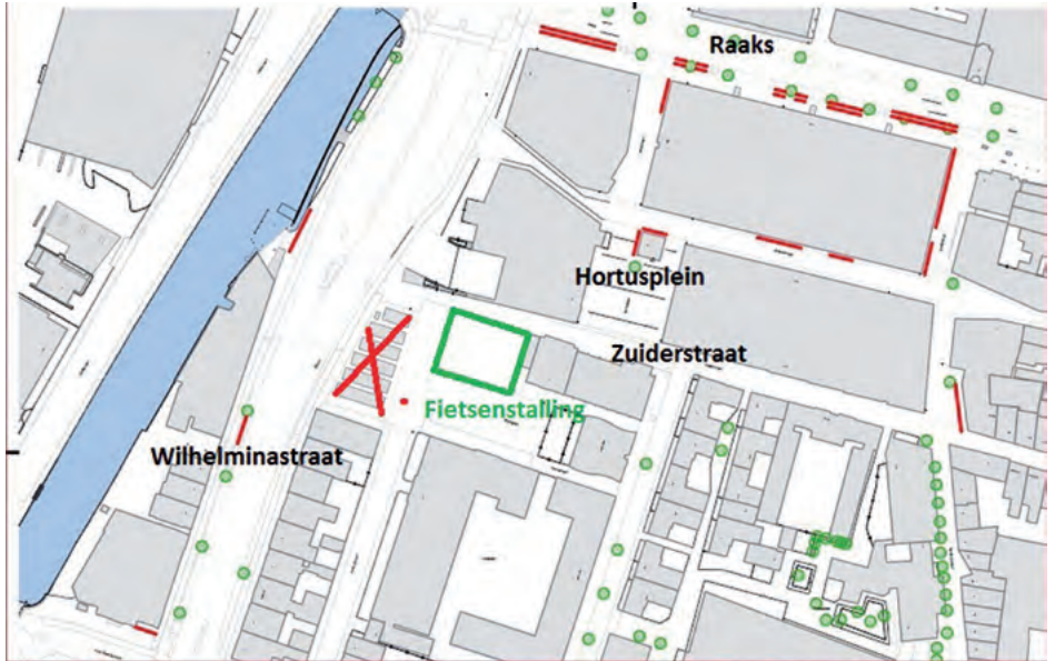
Nieuwe inpandige Raaks fietsenstalling in Zuiderstraat vervangt tijdelijk stalling op het Boereplein.

De ruime capaciteit van de Raaksstalling biedt de mogelijkheid het fietsparkeren te reguleren voor het Hortusplein en omgeving, door onderscheid te maken tussen kortparkeren en langparkeren, waarbij kortparkerende bezoekers hun fiets op straat uitsluitend kunnen plaatsen in klemmen of vakken, met een parkeerduur van maximaal twee, drie of vier uur.