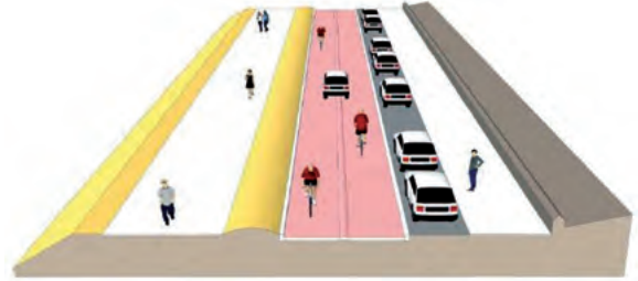
Ruim baan voor voetgangers en fietsers met een brede wandelpromenade en een fietsstraat.

Een ander pijnpunt bleek het asociale gedrag van sommige racefietsers, vooral bij het rijden in groepen. Bewoners zijn bang voor “wielrenterreur” van twee kanten. Tja, in iedere populatie is er een kleine minderheid die zich misdraagt. In dit geval bepalen de “fietscowboys” het imago van de ca. 900.000