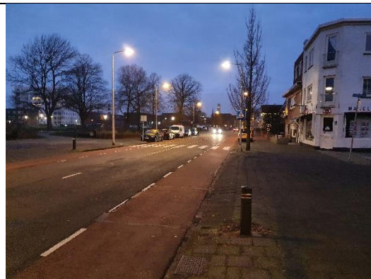
Foto: Zeeweg IJmuiden

De gemeente pleegt in 2022 groot onderhoud aan de Zeeweg. Een gebiedsontsluitingsweg met “krappe” fietsstroken. Helaas kiest de gemeente niet voor een duurzaam veilige inrichting van deze drukke route. Ook onze optie voor verlaging van de maximale snelheid naar 30 km/uur is niet overgenomen. Dit hadden wij wel geadviseerd.