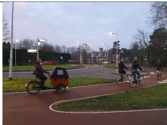
Foto: rotonde Driehuis

Velsen kent een bewogen geschiedenis met betrekking tot rotondes. Dit startte in de jaren 90 (intrede rotondes in Velsen; ook wel genoemd naar de toenmalige wethouder “Kotondes”). De afgelopen jaren zijn diverse rotondes gemoderniseerd en voldoen nu aan de CROW normen. Helaas is Velsersbroek hierop nog een uitzondering. Ander aandachtspunt is de ongevallencijfers op enkele rotondes, onder andere in Driehuis. Vraag hierbij is welke maatregelen mogelijk en nodig zijn zonder de fietser (vaak het slachtoffer) nadelig te raken.