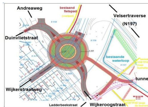
Foto kruising DF-route en Wijkerstraatweg