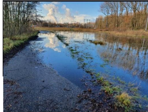
Foto Wijckerpoort-terrein tijdelijk fietspad wordt verlicht.

Onze voorkeur (kruising van de route met de Wijkerstraatweg als "standaard CROW rotonde"), bleek van de drie alternatieven ook voor het autoverkeer de beste waarborg te bieden voor verkeersdoorstroming. De planning van de gemeente Velsen is ons nog niet bekend.