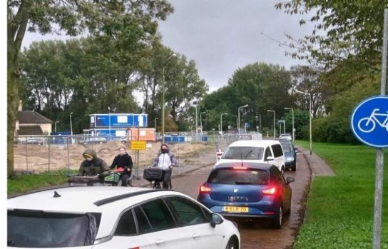
Foto Duinvlietstraat 'sluipverkeer naar N197'

We hebben meegewerkt aan een reportage van de krant 'Op zoek naar de doorfietsroute naar Uitgeest'. Hierin is de voortgang van de route tussen pont en Uitgeest (4 gemeenten!) in beeld gebracht en hebben we de uitdagingen benoemd.