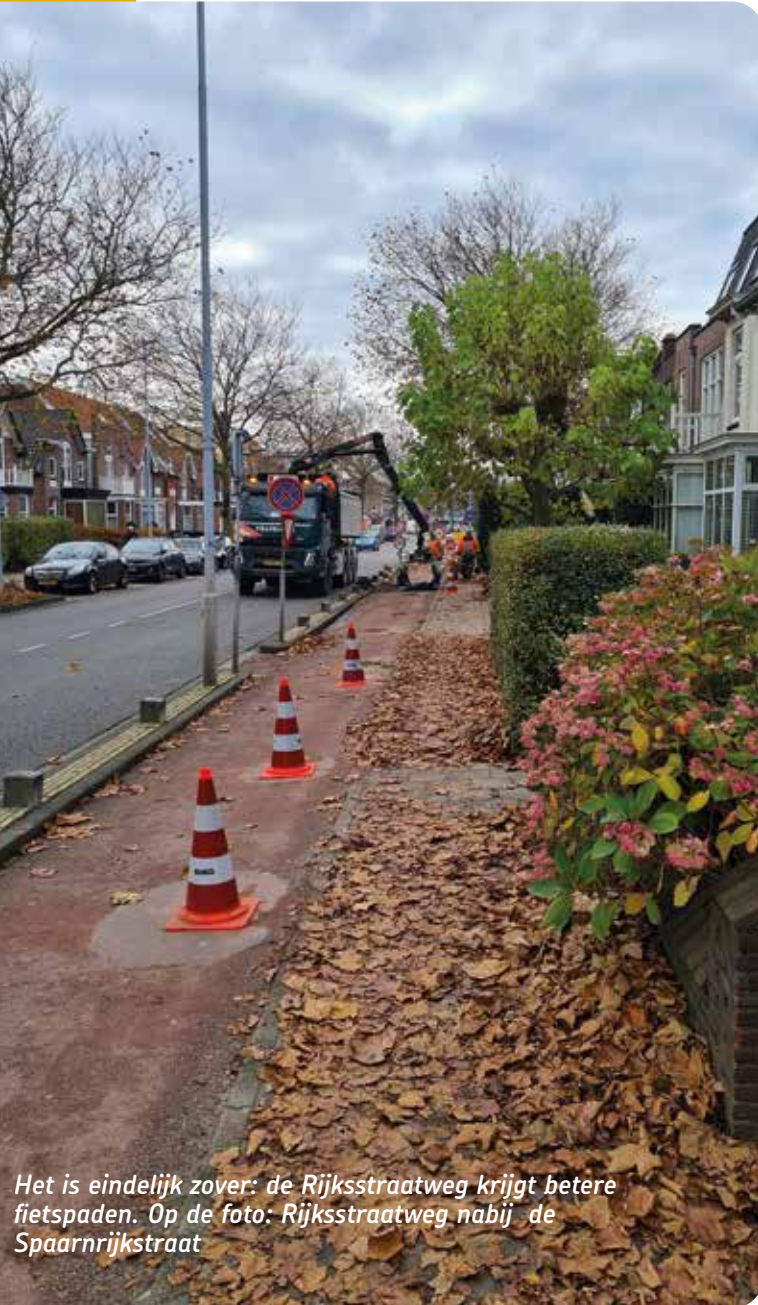
Het is eindelijk zover: de Rijksstraatweg krijgt betere fietspaden. Op de foto: Rijksstraatweg nabij de Spaarnijkstraat

Er is geld vrijgemaakt om het fietspad op de Rijksstraatweg op te knappen. Enkele jaren geleden is een proefstrook van Easypath aangelegd: het gaat om betonnen, uitneembare, platen die wortelopdruk voorkomen. De proefstrook ter hoogte van de Dekamarkt blijkt te voldoen. In november/december is gewerkt aan de westzijde van de Rijksstraatweg nabij de Jan Campertstraat en de Spaarnijkstraat. Vervolgwerkzaamheden staan nog niet gepland.