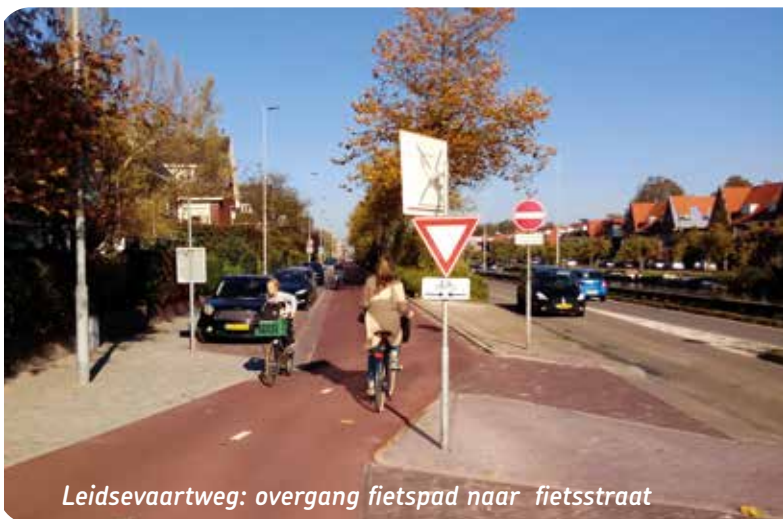
Leidsevaartweg: overgang fietspad naar fietsstraat

Wij blijven ijveren voor deze en andere verbeteringen en houden de opstelling van de lokale partijen bij de gemeenteraadsverkiezingen in de gaten!