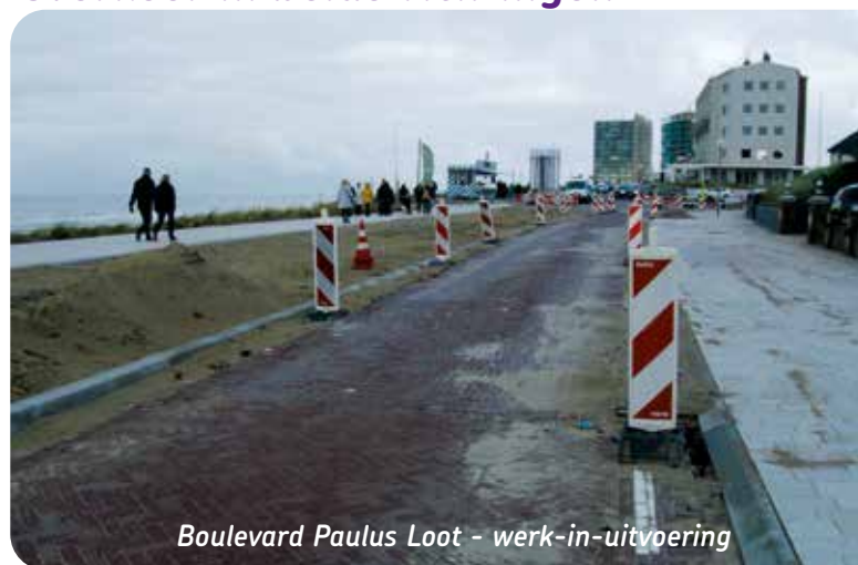
Boulevard Paulus Loot - werk-in-uitvoering

Maar dan steekt de provincie Noord-Holland een spaak in het wiel: ze dreigt de subsidie van € 810.698,- in te trekken, omdat Zandvoort zich niet aan de voorwaarden houdt. Om deze veilig te stellen besloot de Raad op 20 september jongstleden, via een motie, de rijrichting van het autoverkeer op de Boulevard toch maar om te draaien, van zuid naar noord, om daarmee fietsverkeer in beide richtingen op een veilige