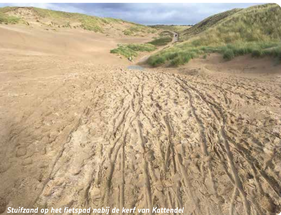
Stuifzand op het fietspad nabij de kerf van Kattendel

De verantwoordelijkheid voor het NPZK is door het Rijk gedelegeerd aan de provincie Noord-Holland. PWN is 'slechts' de beheerder. Wij zijn in gesprek met de provincie over de recreatieve functie van het NPZK, nu en in de toekomst. De algemene discussie 'natuur versus recreatie' ligt gevoelig en roept veel emoties op. Terwijl in Nederland nauwelijks nog sprake is van 'echte' natuur. Dus wat moeten we nog redden en beschermen in onze tekentafelnatuur? Mogen we als Fietzersbond blijven pleiten voor meer fietspaden door het groen, of moeten alle verharde fietspaden (asfalt, beton) door natuurgebieden worden verwijderd, omdat hagedissen, salamanders, slangen, padden, enzovoorts de kans lopen daarop doodgereden te worden? Uw (genuanceerde) reactie op deze uitdagende vragen is welkom.