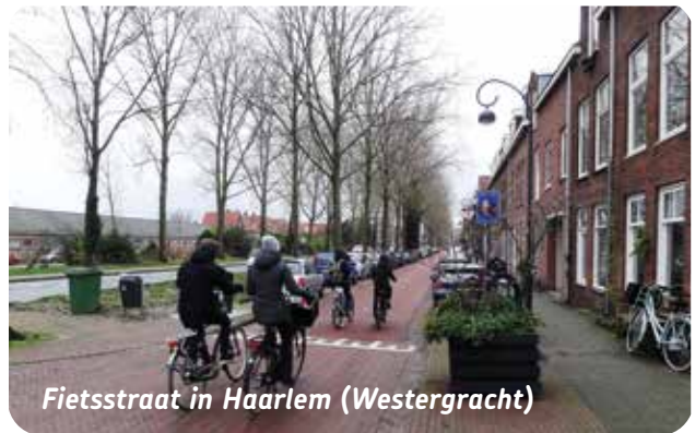
Fietsstraat in Haarlem (Westergracht)

Fietsroutes in de eigen woongemeente worden meestal goed beoordeeld, waarbij vooral de kwaliteit en de zichtbaarheid van de markeringen positief worden beoordeeld. Zeker driekwart is tevreden over stallingsmogelijkheden bij winkelcentra en stadscentra; twee derde is tevreden over de fietsparkeermogelijkheid bij een treinstation. Wel wil 58% meer fietsstraten. Dat bevordert veiliger fietsen. In 2020 is bij 70% van alle ongevallen een fietser betrokken. Zie ook: https://www.fietsersbond.nl/nieuws/aantal-verkeersgewonden-is-topje-van-de-ijsberg/