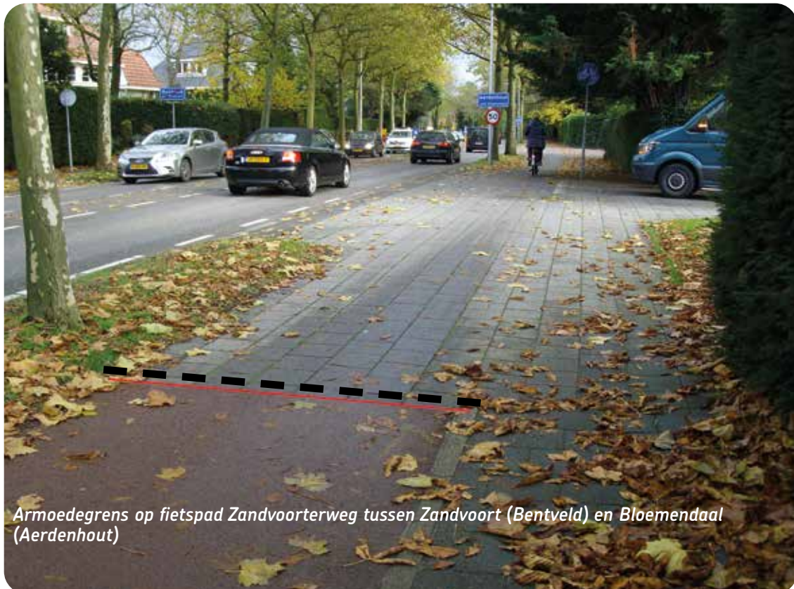
Armoedegrens op fietspad Zandvoortweg tussen Zandvoort (Bentveld) en Bloemendaal (Aerdenhout)

Waar in Bloemendaal het autoverkeer gebruik kan maken van comfortabele geasfalteerde wegen, vraagt de Fietzersbond fietsers hetzelfde comfort te bieden door minimaal de regionale doorfietsroutes te asfalteren en daarmee de verkeersveiligheid te bevorderen. De Fietzersbond doet een beroep op alle politieke partijen in de gemeente Bloemendaal om in hun programma voor de gemeenteraadsverkiezingen 2022 op te nemen dat de fietspaden langs N200, N201 en N208 voorzien dienen te worden van comfortabel rood asfalt. Via de provinciale regeling "Kleine Infrastructuur" is 50% van de uitvoeringskosten subsidiabel. Wellicht is extra subsidie mogelijk uit de "Gemeenschappelijke Regeling Bereikbaarheid Zuid-Kennemerland."