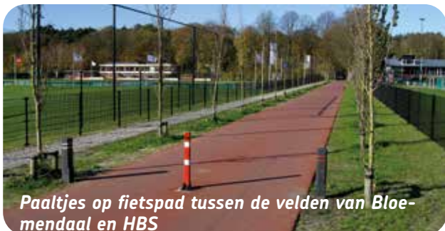
Paaltjes op fietspad tussen de velden van Bloemendaal en HBS

Gemak blijkt een van de belangrijkste redenen om de fiets te pakken. De helft van de ondervraagde fietsers probeert verkeerslichten te vermijden, 48% mijdt drukke fietsroutes. Iets meer dan 60% fietst zo veel mogelijk op autoluwe routes. Deze fietsers lijken minder hinder te hebben van andere