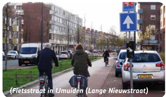
(Fietsstraat in IJmuiden (Lange Nieuwstraat))