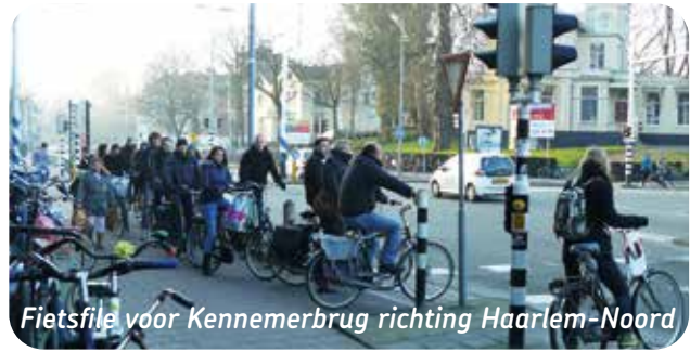
Fietsfile voor Kennemerbrug richting Haarlem-Noord

wegdeelnemers of van het feit dat ze soms lang moeten wachten voor het rode licht.