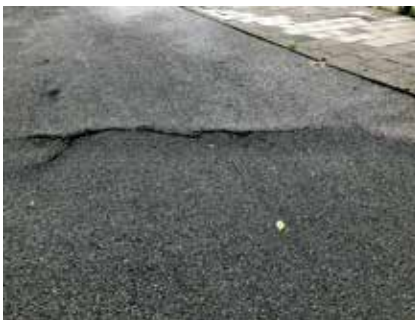
Foto links: Asphalt is niet bestand tegen wortelopdruk. Daardoor breekt het asphalt.

Het geasfalteerde fietspad had last van wortelopdruk en moest worden vernieuwd. Hiervoor is gebruik gemaakt van 'Easypath', dat eerder met succes is toegepast op een deel van het fietspad langs de Rijksstraatweg (aan de zuidkant van de Jan Gijzenbrug). Het bestaat uit gekoppelde betonplaten die ervoor zorgen dat boomwortels de verharding niet kapot kunnen drukken. Groot voordeel is dat ze voor fietsers veilig en comfortabel zijn. Als (lokale) Fietsersbond zijn we supporter van 'Easypath'.