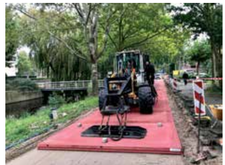
Foto rechts: Het Easypath wordt aangelegd op het Bramelpad. Dit type wegdek voorkomt wortelopdruk