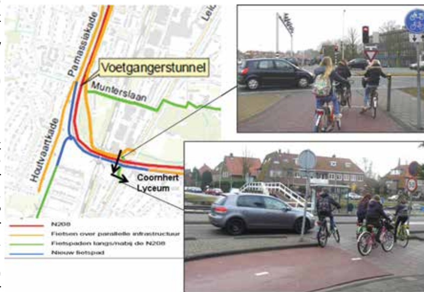
Gevaarlijke situaties: oversteek fietsers (foto dateert uit 2012)