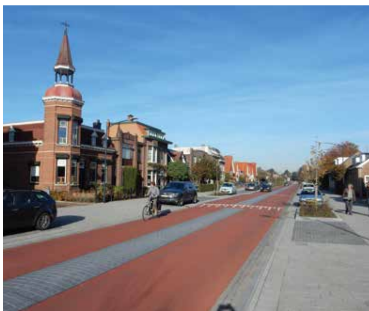
Bergen op Zoom: een gebiedsontsluitingsweg, maar wel uitgevoerd als fietsstraat en dat zie je niet vaak.