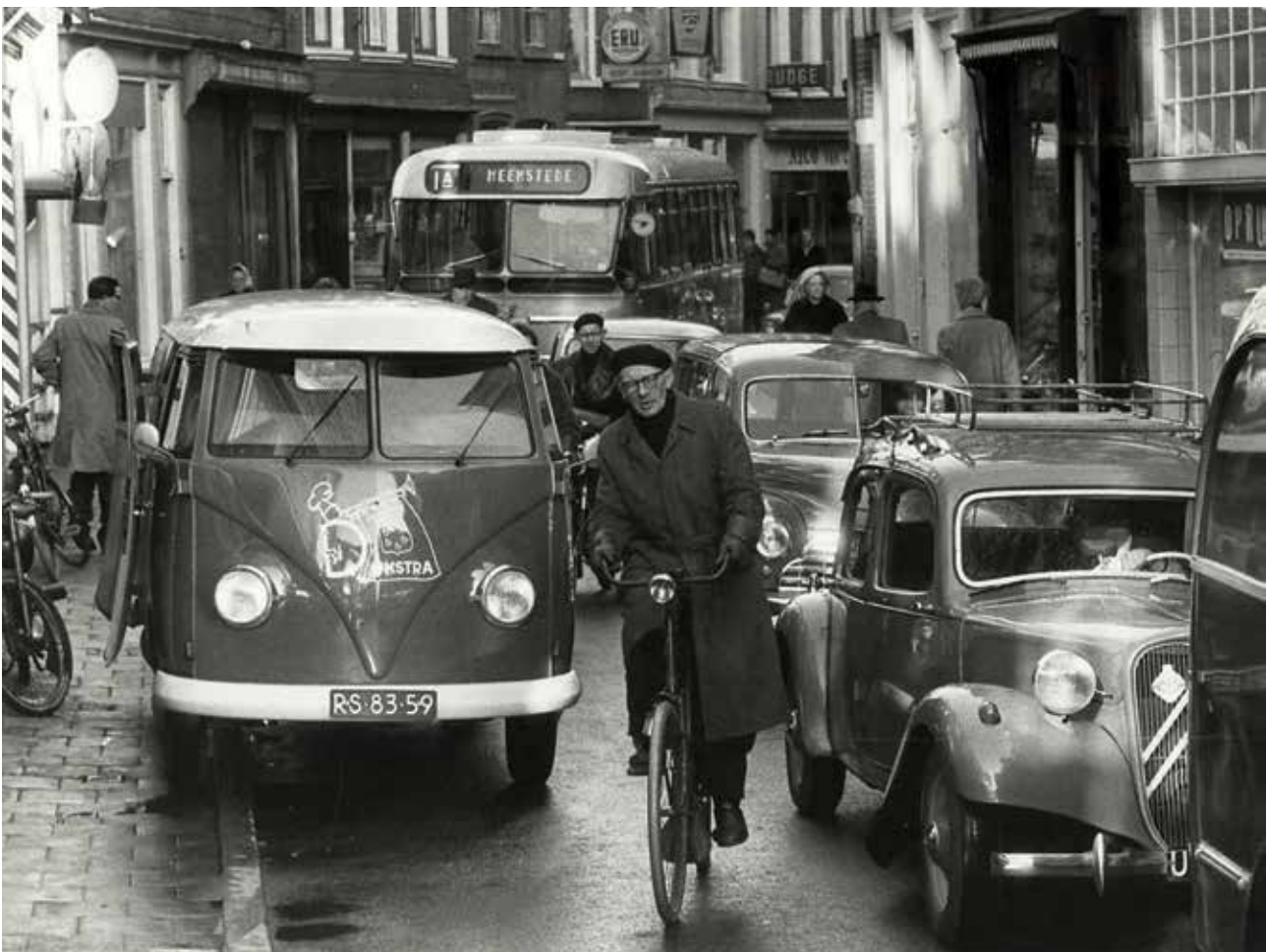
Fietsers, auto's en een stadsbus in de Gierstraat (1958)

Zie ook onze website voor de inspraaknotitie die wij hierover hebben opgesteld: https://haarlem.fietsersbond.nl/dossiers2/haarlem/centrum-gierstraat-vijfhoek/