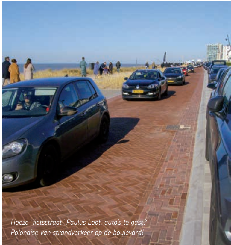
Hoezo "fietsstraat" Paulus Loot, auto's te gast? Polonaise van strandverkeer op de boulevard!