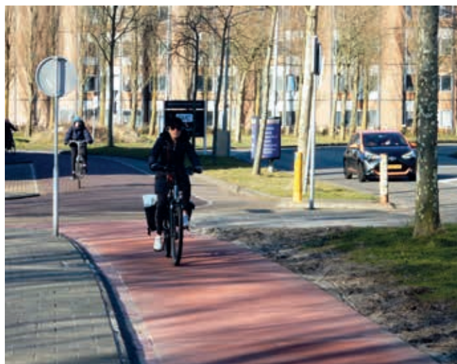
Deze twee foto's laten zien hoe mooi het gereedgekomen deel van de Haarlemse Rijksstraatweg er bij ligt.