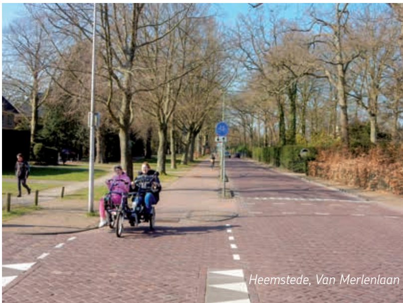
Heemstede, Van Merlenlaan

Waar moeten we als fietsers op blijven letten? Dit is een proces van lange duur, waar de komende tien jaar 13 miljoen euro voor is uitgetrokken. Niet alle straten kunnen tegelijk aan de beurt komen. De planning hangt samen met bijvoorbeeld vervanging van riolering of wegdek. Zo is de Van Merlenlaan door verouderde riolering direct aan de beurt. Daarbij is ervoor gekozen het vrijliggende fietspad (zie foto) niet te handhaven, maar