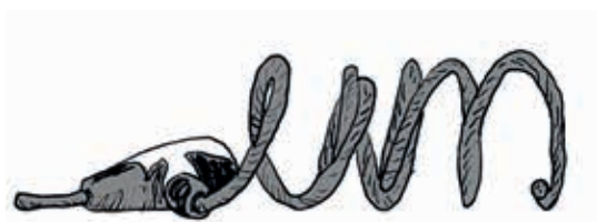
Doe altijd aangifte.

Zoals uit bovenstaand staatje valt af te lezen, daalt, met uitzondering van Zandvoort, in de hele regio het aantal aangiften van diefstal van niet-elektrisch ondersteunde fietsen fors. Ook opvallend is het sterk dalende aantal aangiftes. Dat heeft mede te maken met het feit dat mensen er geen vertrouwen in hebben dat de fiets teruggevonden wordt. Overheden (gemeenten en Rijk) en politie hebben nauwelijks beleid ontwikkeld om fietsendiefstal te voorkomen of te beperken. Zo vervangt de gemeente Haarlem op een behoorlijk aantal plaatsen fietsklemmen door fietsvakken, waardoor de mogelijkheid tot aanbinden verdwijnt.