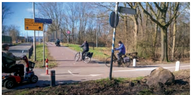
Herman Harsveldpad zijde Wijkmeerweg (B-route Tata-verkeer): De afsluitpaal (rood-wit) is verplaatst naar links. Deze stond eerder tussen de twee wit geleverde palen. De haakse bocht in deze route is nu wat veiliger te nemen. De route verbindt de pont met de bedrijventerreinen in Velsen-Noord en de Trompet in Heemskerk.

De Fietsersbond wil obstakelvrije fietspaden om het aantal eenzijdige ongelukken te verminderen. Paaltjes en dergelijke zijn vaak niet noodzakelijk en als ze dat wel zijn, vereisen ze herkenbaarheid en veiligheid, zoals de CROW voorschrijft. Hierbij stellen we ook vast dat incidenteel ongewenst (auto)gebruik van een fietspad zelden opweegt tegen het voortdurende gevaar van obstakels op of langs de weg. Verder wijzen wij op het onderhoud. De fietsvoorzieningen in Velsen zijn nu regelmatig het sluitstuk van vegen (bladeren, takken, sneeuw).