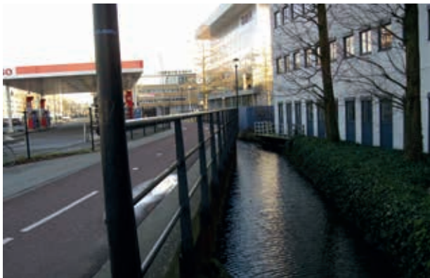
Foto boven: Voorbeeld van een railing langs de waterkant, zoals die geplaatst is bij de Schipholweg langs de sloot die voor het Van der Valk hotel loopt.

Het fietspad is weinig vergevingsgezind, hetgeen betekent dat, als je een fout maakt, spelletjes speelt of op je fiets stapt met drank op, de gevolgen van een val in het water ernstig of, zoals in dit geval, zeer ernstig zijn, zeker