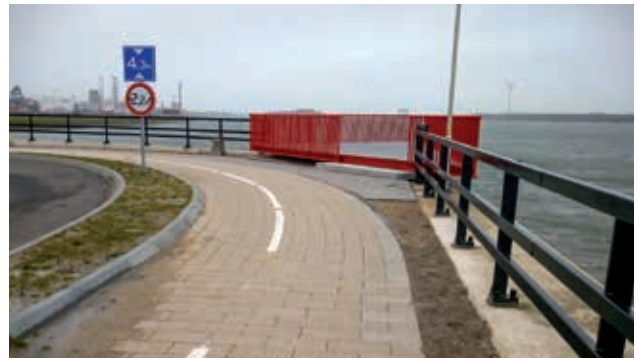
Uitzichtpunt zijde Middensluis (fietspad in tegels, een voetpad of loopstrook ontbreekt).

Ondanks bovenstaande kanttekening heeft onze samenwerking met Rijkswaterstaat in het dijkversterkingsproject Sluizen IJmuiden verbeteringen opgeleverd. We zien dat op de vastgestelde ontwerptekening het tweerichtingsfietspad conform de CROW-richtlijn 3,5 m breed wordt en wel in asfalt wordt aangelegd (planning 2023?). Helaas geldt dat dan weer niet voor het fietspad langs de Noordersluisweg. Voorafgaand aan de opening van de sluisroute is het gedeelte vanaf de Staalhavenweg in Velsen-Noord tot aan de Noordersluis