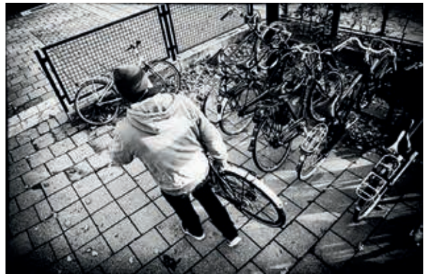
Fiets weg? Kijk altijd even in de buurt.