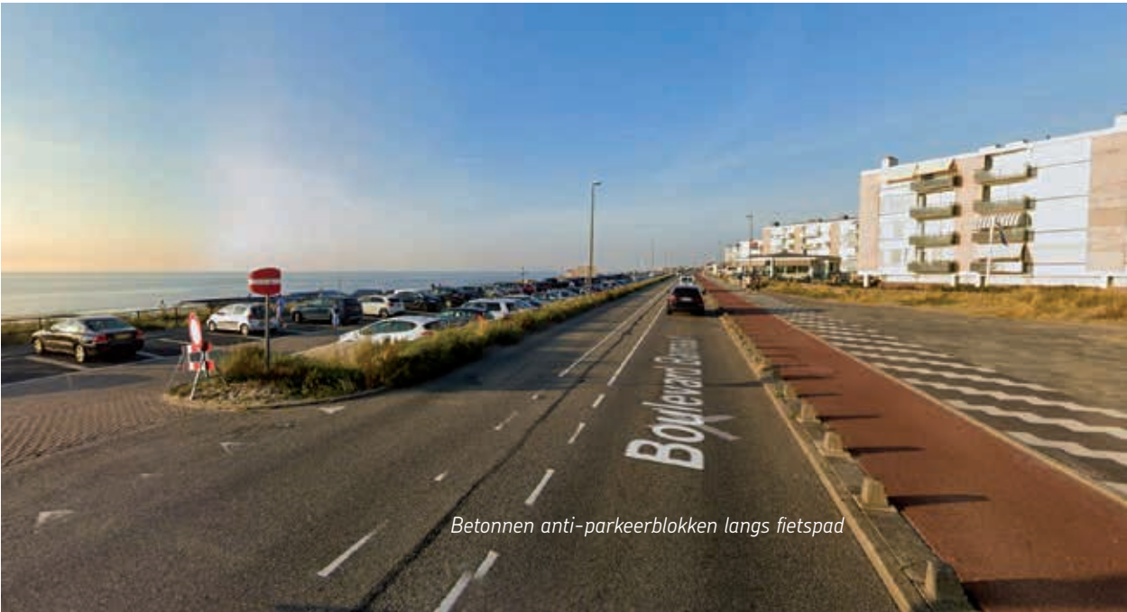
Betonnen anti-parkeerblokken langs fietspad

"Bij een ernstig verkeersongeval in Zandvoort is dinsdagavond 20 juli 2021 een 23-jarige man uit Hoofddorp zwaargewond geraakt. Ook een traumahelikopter kwam ter plaatse. Het ongeval gebeurde rond kwart voor twaalf op de Boulevard Barnaart. Een scooter botste op een paaltje, waarna de bestuurder hard ten val kwam. Bij die klap raakte het slachtoffer zwaargewond." (Haarlems Dagblad).