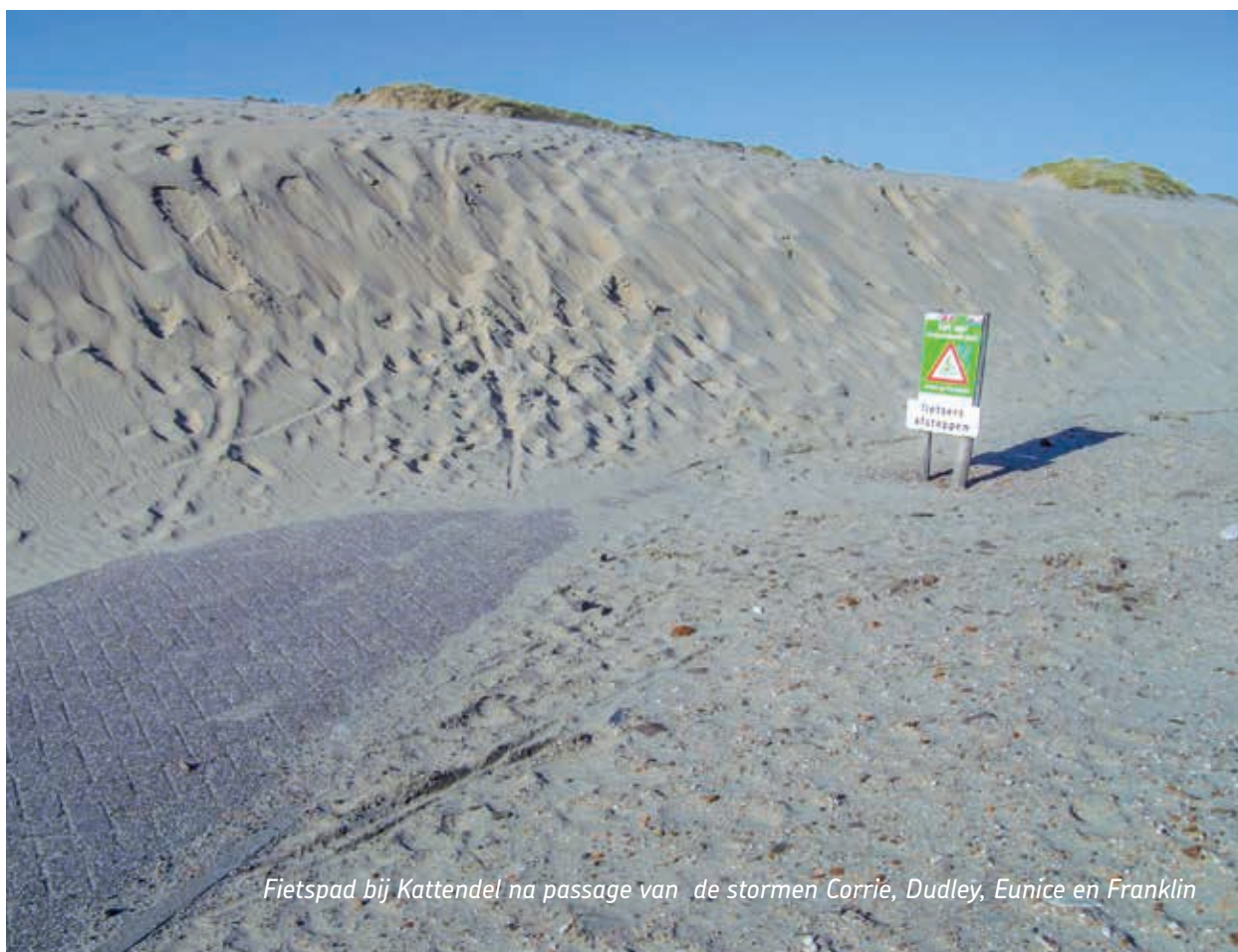
Fietspad bij Kattendel na passage van de stormen Corrie, Dudley, Eunice en Franklin