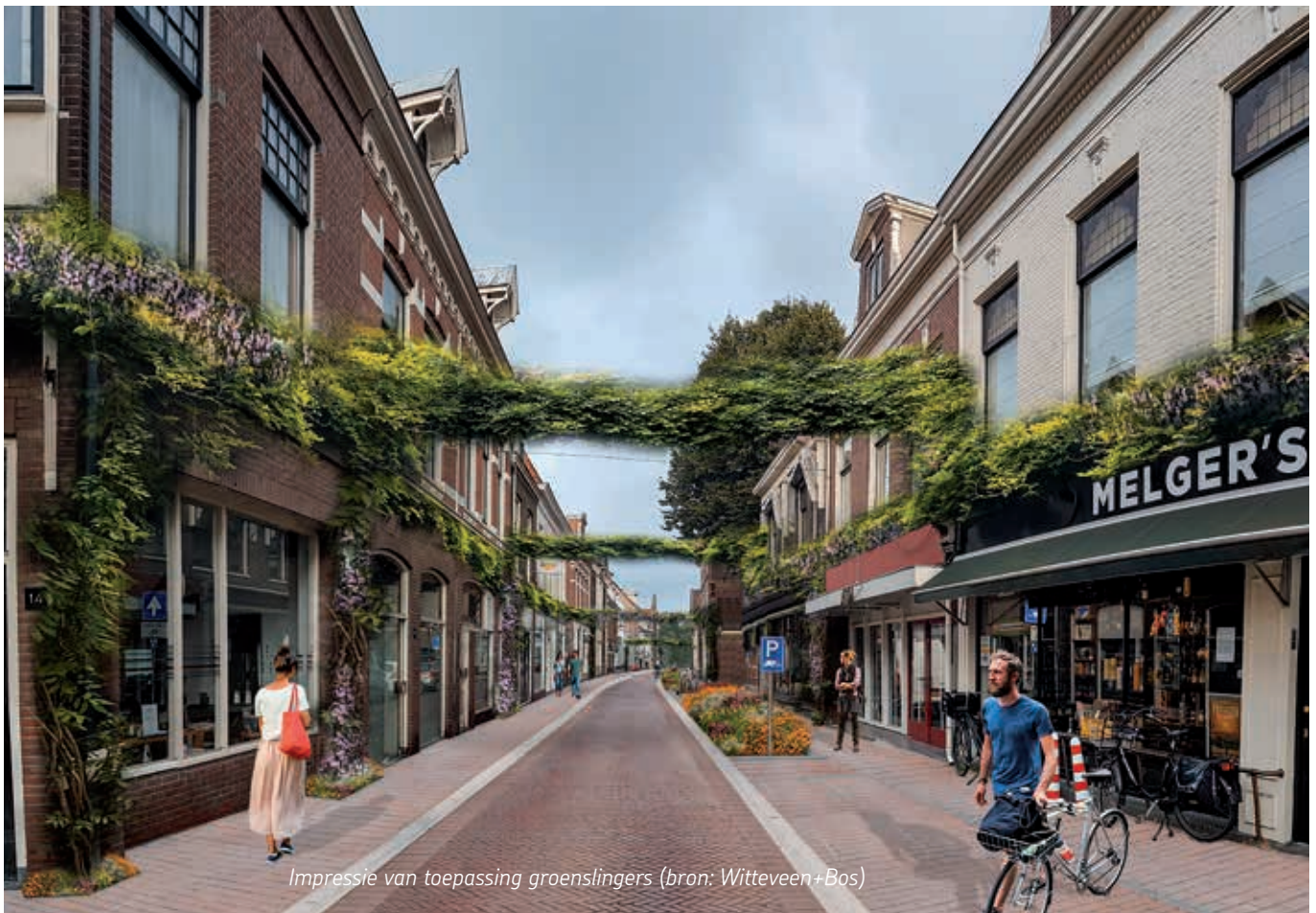
Impressie van toepassing groenslingers

De aansluiting van de fietsstraat op de Wilhelminastraat wordt in 2024/2025 aangepast tijdens een reconstructie van de Raaksbruggen, waarbij fietsers, voetgangers en OV prioriteit krijgen boven auto's.