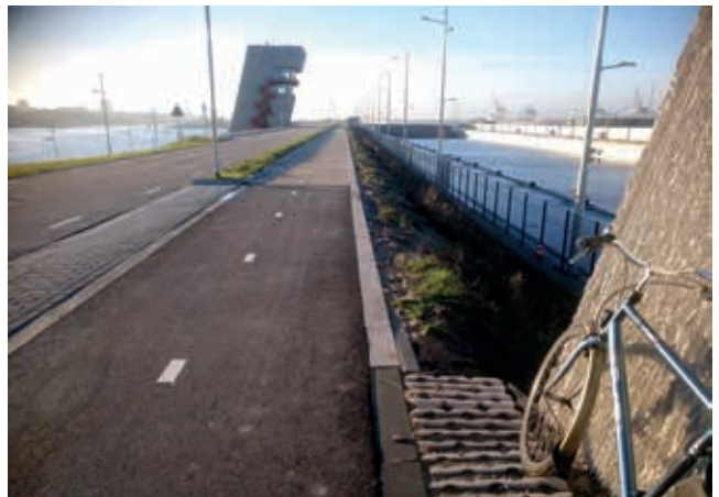
Fietspad langs de nieuwe zeesluis.

in het voorjaar van 2021 geasfalteerd en slechts 2,5 m breed. Fietsers moeten ook nog eens 3 à 4 keer een autoweg kruisen, omdat fietspaden ontbreken op de bruggen en sluisdeuren. De weg en fietspaden aan de zuidzijde van de Middensluis vallen buiten beide projecten, net als het fietspad aan de noordzijde van de Noordersluis dat in abominabele toestand verkeert. Het geheel van de sluisroute is dus een lappendeken aan verhardingen, inrichtingen en verkeerslichten geworden en steekt af ten opzichte van het paradepaardje van Nederland: 's werelds grootste zeesluis!