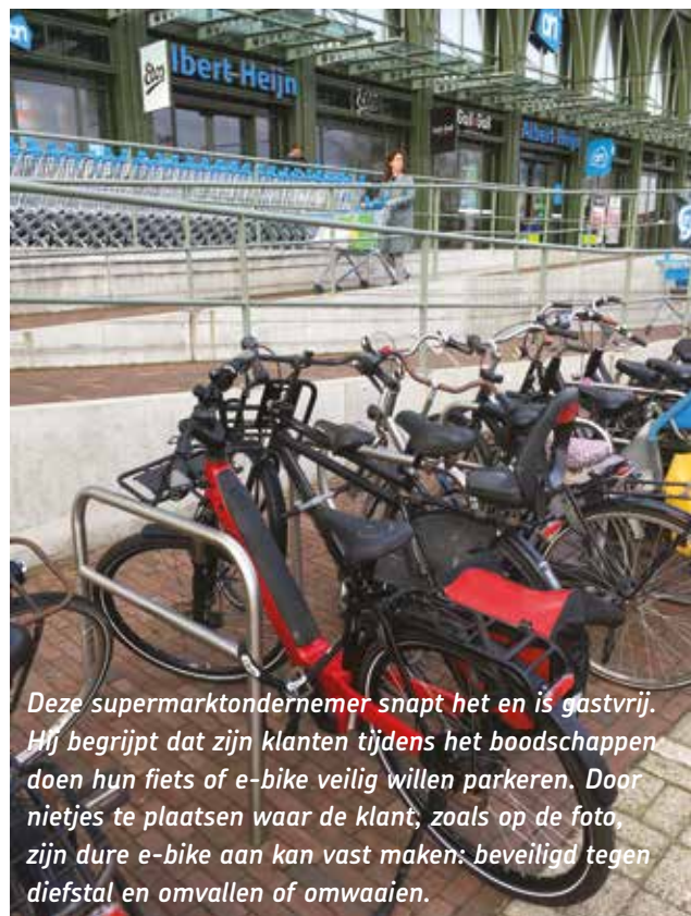
Deze supermarktondernemer snapt het en is gastvrij. Hij begrijpt dat zijn klanten tijdens het boodschappen doen hun fiets of e-bike veilig willen parkeren. Door nietjes te plaatsen waar de klant, zoals op de foto, zijn dure e-bike aan kan vast maken: beveiligd tegen diefstal en omvallen of omwaaien.

Alle organisaties die zich met de fiets bezighouden, adviseren met klem: zet je fiets met een tweede slot vast aan de vaste wereld: (middels fietsbeugels of -klemmen als Tulips en nietjes, aan palen, hekken, bomen, enzovoorts) . De beide Haarlemse wethouders hebben hier geen boodschap aan. Zij gaan door met het aanbrengen van fietsvakken. Het bestrijden van fietsdiefstal heeft voor hen geen prioriteit. Sterker nog: met hun vakkenbeleid faciliteren zij fietsdiefstal.