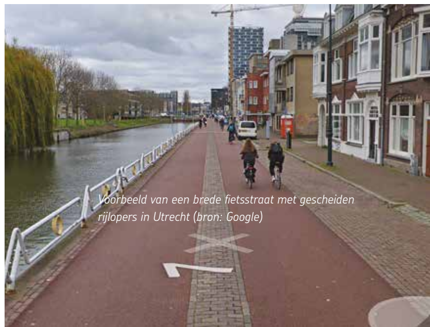
Voorbeeld van een brede fietsstraat met gescheiden rijlopers in Utrecht