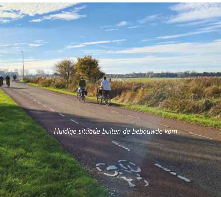
Huidige situatie buiten de bebouwde kom

Het voorstel van de Fietzersbond is om de weg even breed te houden, met bredere fietsstroken en een smalere rijloper. Een andere optie is om de weg als een brede fietsstraat in te richten, met twee gescheiden rijlopers (foto rechtsonder). Dit profiel zal nota bene ook toegepast worden op het deel van de Spaarndamseweg binnen de bebouwde kom, langs de woonboten.