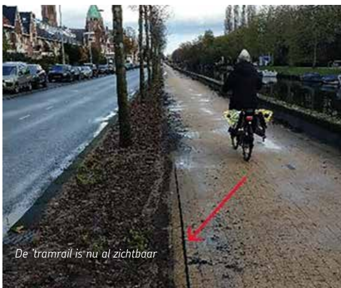
De 'tramrail' is nu al zichtbaar

De letterlijke tekst van de meldingen/reacties kunt u opvragen bij de redactie: regio/haarlem@fietsersbond.nl