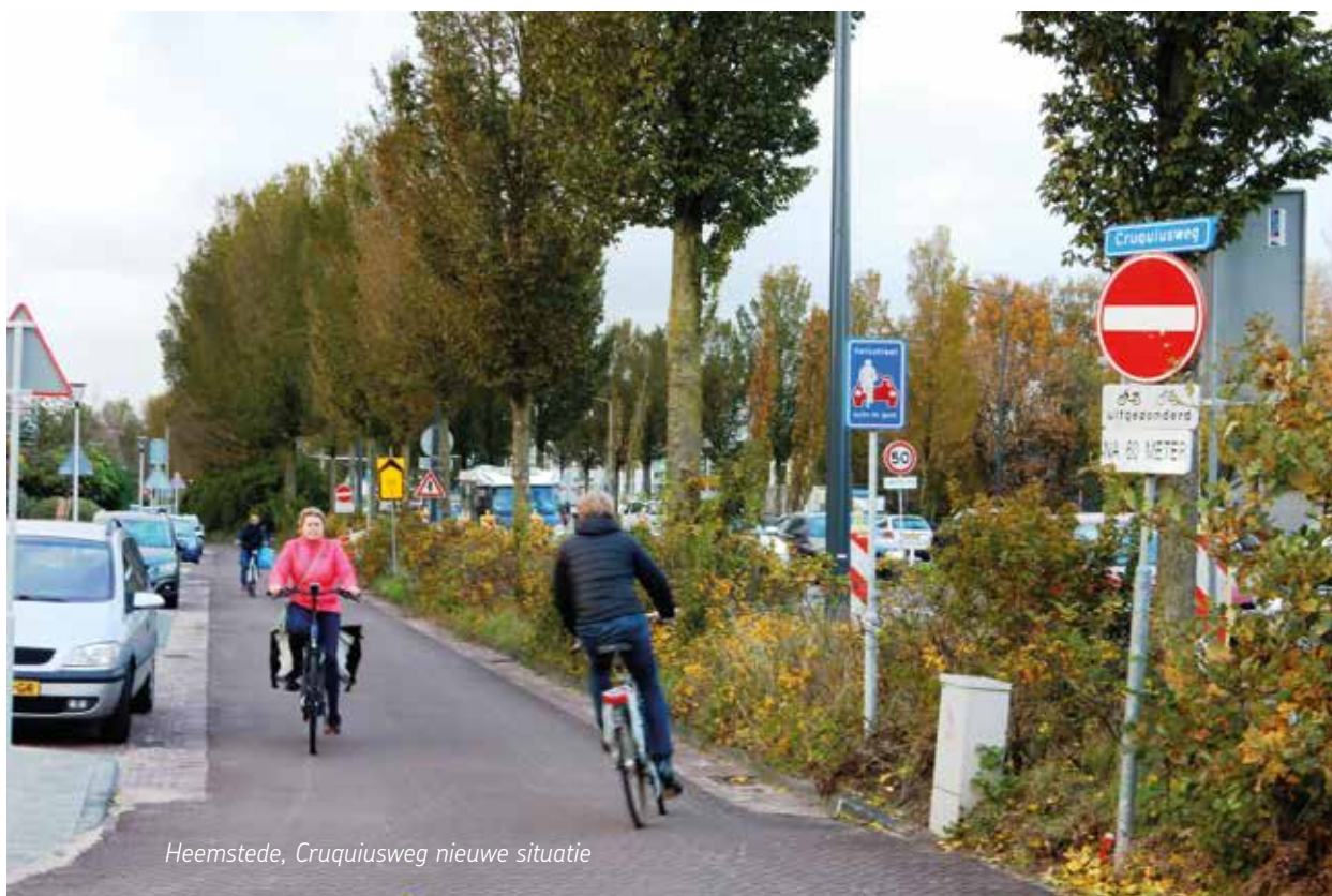
Heemstede, Cruquiusweg nieuwe situatie

We schreven hierover al in 2018. Op zijn minst zouden de fietsstroken vanaf de nieuwe brug met ruime fietsstroken doorgetrokken kunnen worden richting Heemstedesedreef. Storend is vooral de rij wachtende (vracht) auto's voor de Milieustraat en de drukke kruising van de Javalaan met de Cruquiusweg. Veel scholieren gebruiken deze route op weg naar College Hageveld.