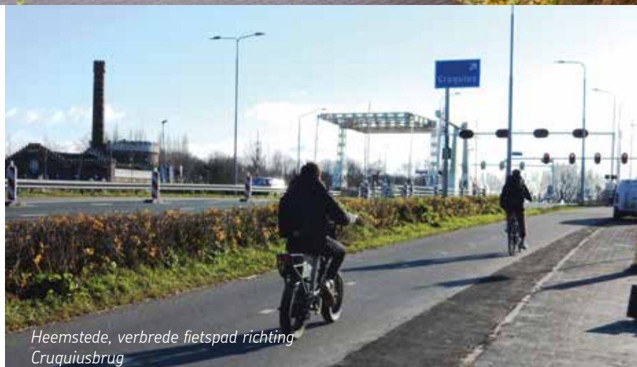
Heemstede, verbrede fietspad richting Cruquiusbrug