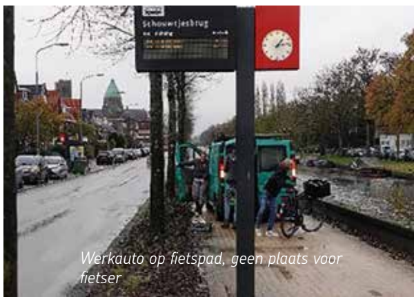
Werkauto op fietspad, geen plaats voor fietser

De gemeente gebruikt te lichte banden om het fietspad op te sluiten. "Er is een opsluitband terug geplaatst. Het straatwerk is dus opgesloten", antwoordt de gemeente. Dat was mijn vraag niet, ik meldde: "de band is te zwak." En ja hoor, twee weken later is die kant van het fietspad al kapot gereden; het begin van een 'tramrail' is er. Er gaan nu eenmaal ook auto's, bv werk-, veeg- en strooiwagens over het fietspad. Dat gewicht moet een band kunnen weerstaan. Niet dus (zie foto's onder).