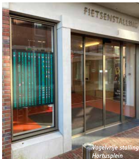
Vogelvrije stalling Hortusplein

De Fietsersbond is van mening dat alle Haarlemse openbare fietsenstallingen uniform “bemenst-bewaakt” dienen te worden met een bonnetjessysteem of een modernere of digitale variant. Dan hoeven fietsers zich geen zorgen te maken of hun fiets er nog wel staat als ze die komen ophalen. De gemeente Haarlem voert geen actief beleid op fietsdiefstal. De prioriteit behelst helaas vooral, zoals ze het zelf benoemt, “de overlast van geparkeerde fietsen in de binnenstad te beperken of te stoppen” .