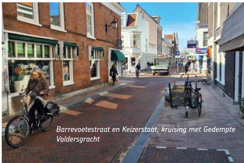
Barrevoetstraat en Keizerstraat, kruising met Gedempte Voldersgracht