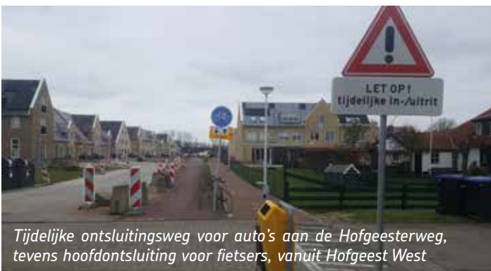
Tijdelijke ontsluitingsweg voor auto's aan de Hofgeesterweg, tevens hoofdonsluiting voor fietsers, vanuit Hofgeest West

In juni 2021 is in de gemeenteraad een motie "onderzoek inrichting kruispunten ontsluiting Hofgeest" aangenomen. Aangezien het aantal te verwachte autobewegingen met circa 25% toeneemt, voorziet de gemeente dat de huidige inrichting niet toereikend zal zijn voor twee wijkontsluitende kruisingen (Rijksweg-N20 en de Kamp-Velsersbroekse Dreef). In de motie is benadrukt dat grote (woningbouw)ontwikkelingen zoals Hofgeest bij uitstek aanleiding zijn om eventuele problemen van omliggende infrastructuur te onderzoeken en waar nodig integraal aan te pakken. Wij constateren dat de gemeente nauwelijks heeft ingegrepen. De kruising Rijksweg - N208 richting Beeckestijn is sinds een half jaar voorzien van een VRI waarin de fietsoversteek niet is meegenomen. Deze oversteek ligt ongewijzigd na het viaduct, circa 50 meter voor het verkeerslicht.