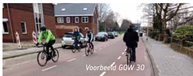
Voorbeeld GOW 30

Ook geven wij er de voorkeur aan de bestaande fietspaden de status van voetpad met 'fietsers te gast' te geven. Toeristische fietsers kunnen dan zonder hinder van het snellere verkeer in alle rust genieten van het sluis- en hoogovencomplex. In feite functioneert de verhoogde weg tussen Middensluis en Nieuwe Sluis als een lang uitzichtpunt.