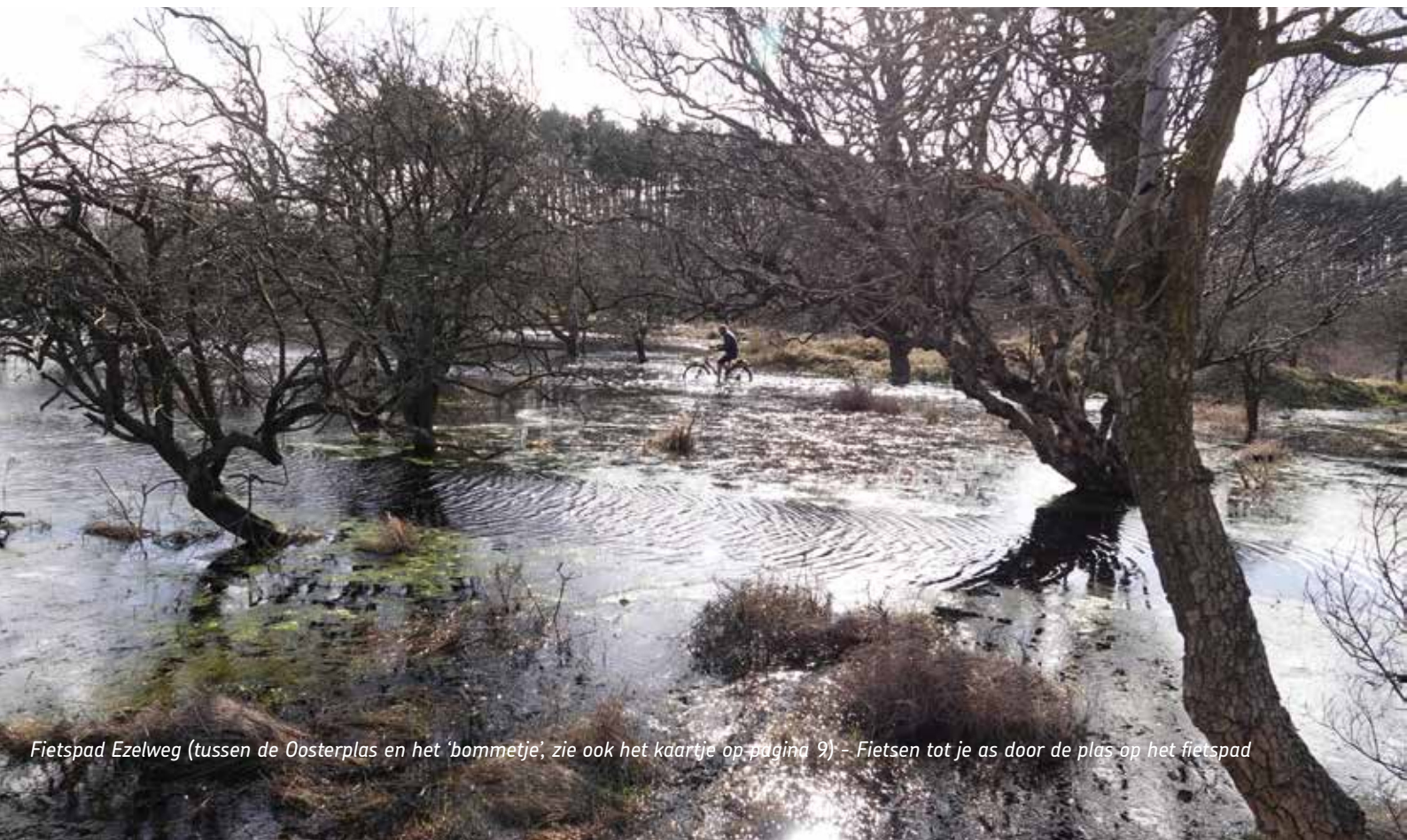
Fietspad Ezelweg (tussen de Oosterplas en het 'bommetje', zie ook het kaartje op pagina 9) - Fietsen tot je as door de plas op het fietspad