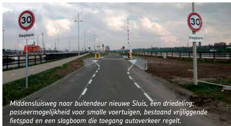
Middensluisweg naar buitendeur nieuwe Sluis, een driedeling: passeermogelijkheid voor smalle voertuigen, bestaand vrijliggende fietspad en een slagboom die toegang autoverkeer regelt.

Wij vinden dat vanaf de brug bij IJmuiden tot en met de sluisdeuren van de Noordersluis, een vorm van GOW 30 met asfaltverharding voor de fiets prima kan functioneren, mits de fietsers bij filevorming passeermogelijkheid behouden.