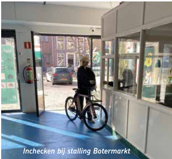
Inchecken bij stalling Botermarkt

Als je je fiets weer ophaalt, wordt dat bonnetje vergeleken met het stuurlabeltje. Je neemt de fiets mee waarmee je ook bent gekomen. Dit validatiesysteem heet “bemenst-bewaakt” . Volgens de medewerker van “Haarlem Werkt” (het vroegere Paswerk) in de Botermarkt stalling is er in zijn stalling nog nooit een fiets gestolen.