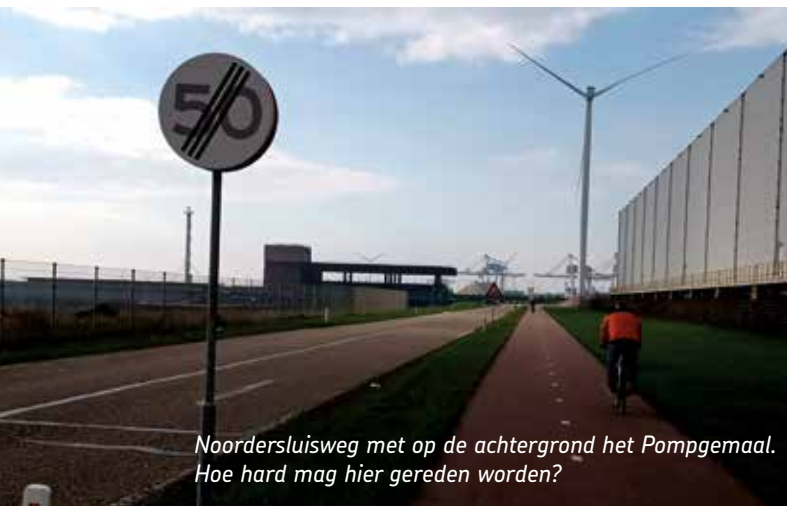
Noordersluisweg met op de achtergrond het Pompgemaal. Hoe hard mag hier gereden worden?

Hierdoor is het onduidelijk geworden wat de toegestane maximumsnelheid is. Motoren en auto's maken van die onduidelijkheid nu al enthousiast gebruik en rijden er soms erg hard. Voor de fietser geen veilig gevoel!