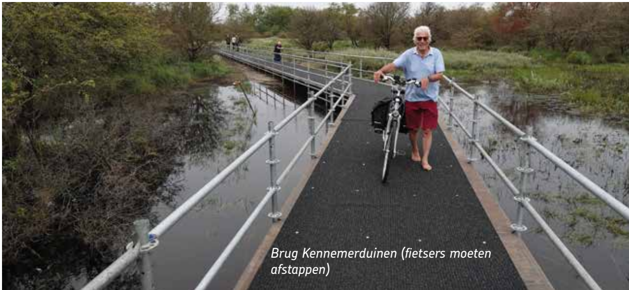
Brug Kennemerduinen (fietsers moeten afstappen)

Aan het begin van de zomervakantie heeft PWN de fietsroute van ingang Bleek en Berg naar Parnassia weer opengesteld voor fietsers. Sinds november vorig jaar was het strand door de duinen niet bereikbaar vanwege de enorme hoeveelheid regen die in 2023 is gevallen. Wat natuurlijk ook niet hielp was het regenachtige voorjaar, waardoor het water nauwelijks kon verdampen.