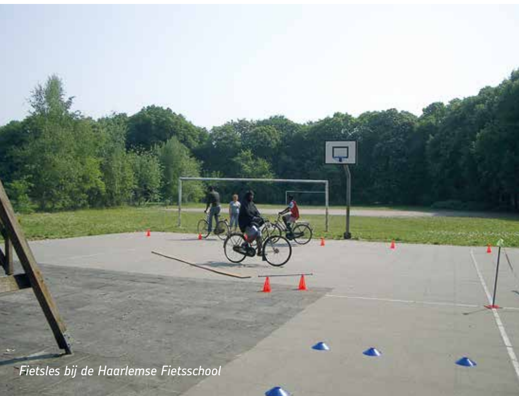
Fietsles bij de Haarlemse Fietsschool

Naast de subsidie van de gemeente, is de ondersteuning vanuit de wijkcentra essentieel: daar komen de meeste deelnemers vandaan. Met hun hulp is 2024 nu al het succesvolste jaar tot nu toe.