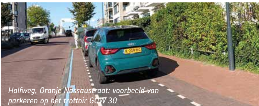
Halfweg, Oranje Nassastraat: voorbeeld van parkeren op het trottoir GOW 30