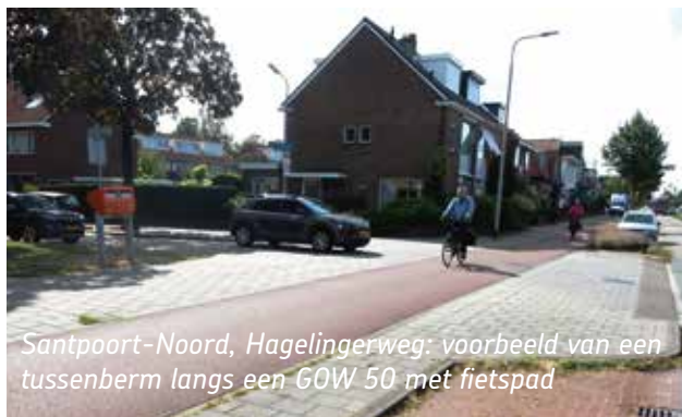
Santpoort-Noord, Hagelingerweg: voorbeeld van een tussenberm langs een GOW 50 met fietspad