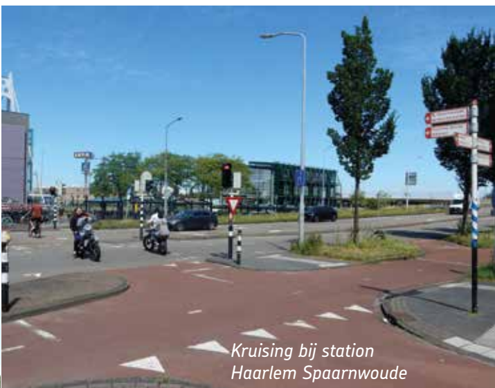
Kruising bij station Haarlem Spaarwoude

(Vervolg pagina 8 - Doorfietsroute Hoofddorp station naar Haarlem)