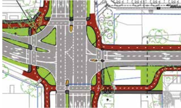
Kruispunt Amerikaweg (breed) - Boerhaavelaan

negasthuis moet oversteken. Na het Zuster Rebelpad wordt gebruik gemaakt van de ventwegen. Ook komt er meer groen, inclusief bomen en een ondergrondse opvang van regenwater.