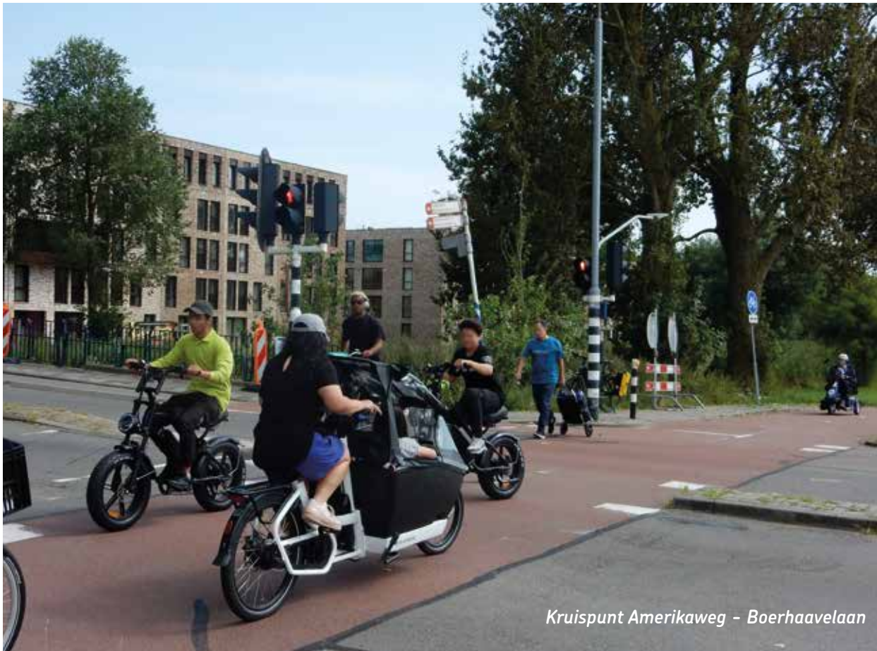
Kruispunt Amerikaweg - Boerhaavelaan

In de tweede fase wordt de rijbaan van de Boerhaavelaan opnieuw ingericht. Het werk is in het voorjaar van 2025 gereed. Dit betekent tot die tijd veel omrijden, vooral voor het autoverkeer. De kruising van de Amerikaweg en de Schipholweg komt later aan bod. Er komt in ieder geval een fietsoversteek aan de zuidzijde van de Schipholweg..