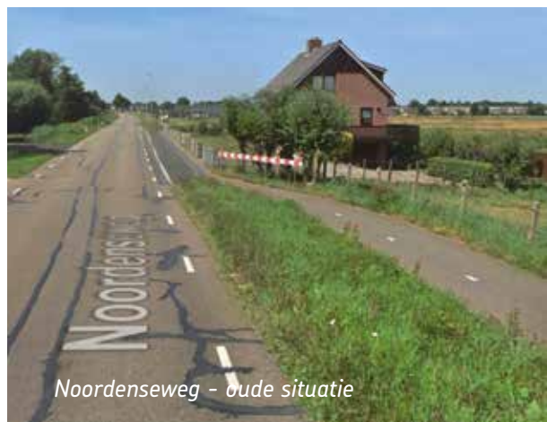
Noordenseweg - oude situatie

De Fietsersbond Alphen aan den Rijn heeft zich jarenlang sterk gemaakt om deze onveilige situatie aan te pakken. Nu is er dan een recht fietspad tot ieders tevredenheid (zie foto rechtsonder).