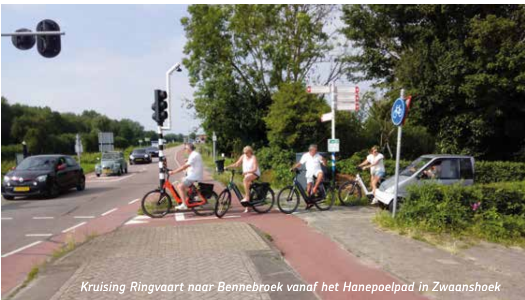
Kruising Ringvaart naar Bennebroek vanaf het Hanepoelpad in Zwaanshoek

De Fietsersbond Haarlemmermeer zal deze punten onder de aandacht te brengen bij de gemeente Haarlemmermeer.