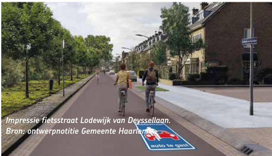
Impressie fietsstraat Lodewijk van Deysellaan.

Volgens de planning van de gemeente start de uitvoering nog in 2024.