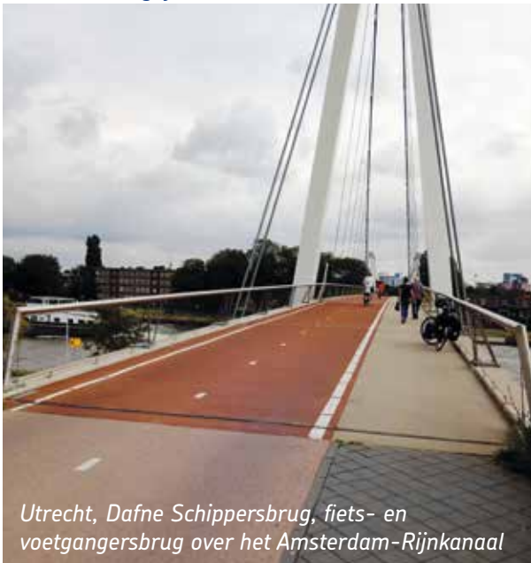
Utrecht, Dafne Schippersbrug, fiets- en voetgangersbrug over het Amsterdam-Rijnkanaal

Volgens een onderzoek van Buycycle is Utrecht de meest fietsvriendelijke provincie van Nederland. Deze positie dankt zij aan de grootste totale lengte fietspaden per vierkante kilometer en de kwaliteit van het netwerk. Utrecht heeft een totale fietsnetwerklengte van 5,1 km per km 2 . “Dit netwerk omvat veilige fietspaden, gescheiden fietsstroken, suggestiestroken en vrijliggende fietspaden, waardoor fietsen in Utrecht veiliger en comfortabeler is”, schrijft Buycycle. Ook heeft de provincie veel recreatieve fietsroutes: in totaal zijn het er 160.