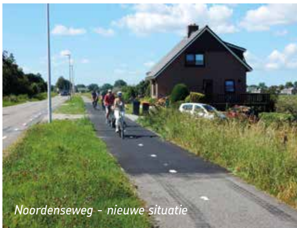
Noordenseweg - nieuwe situatie