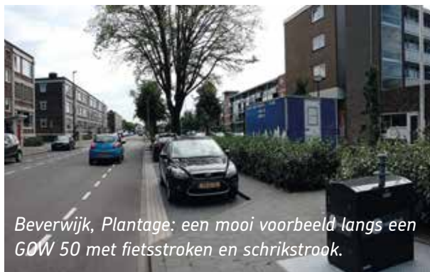
Beverwijk, Plantage: een mooi voorbeeld langs een GOW 50 met fietsstroken en schrikstrook.

Zoals in bovenstaand artikel is aangegeven luidt de vraag: "Waar in gemeente Velsen is het wegprofiel onveilig?" Als u een knelpunt weet, meld het ons!