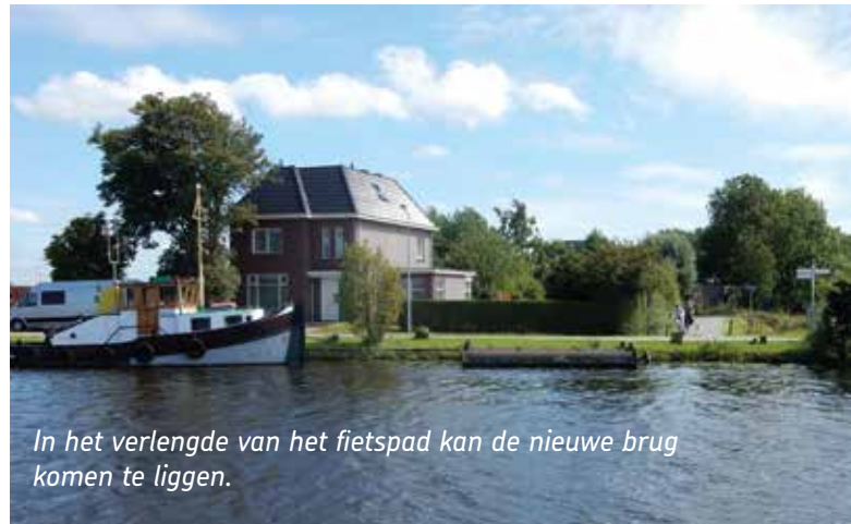
In het verlengde van het fietspad kan de nieuwe brug komen te liggen.