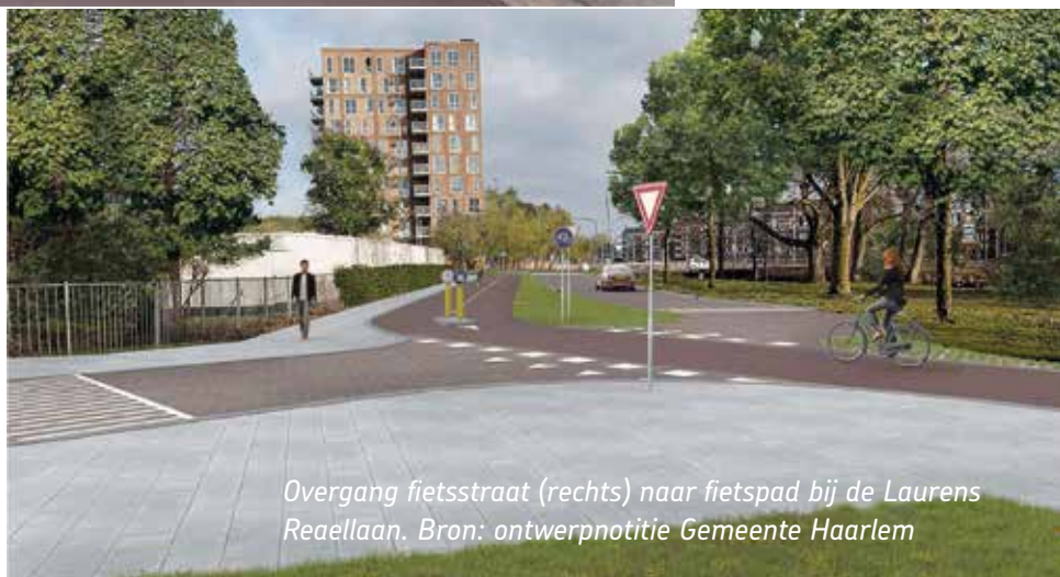
Overgang fietsstraat (rechts) naar fietspad bij de Laurens Reaellaan.