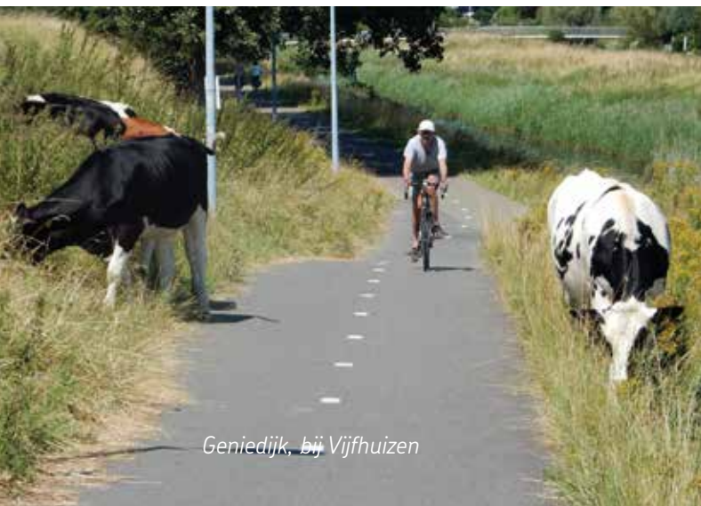
Geniedijk, bij Vijfhuizen

De Fietsersbond is betrokken geweest bij eerdere onderzoeken, zoals de onderdoorgang van de Schipholweg, de brug over de Ringvaart en de passage van het spoor en de Amsterdamsevaart. De Geniedijk ontbrak in voorgaande studies.