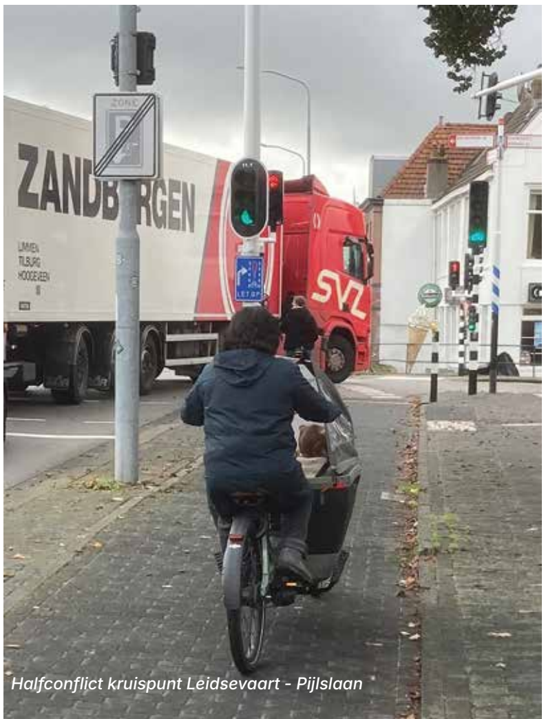
Halfconflict kruispunt Leidsevaart - Pijlslaan