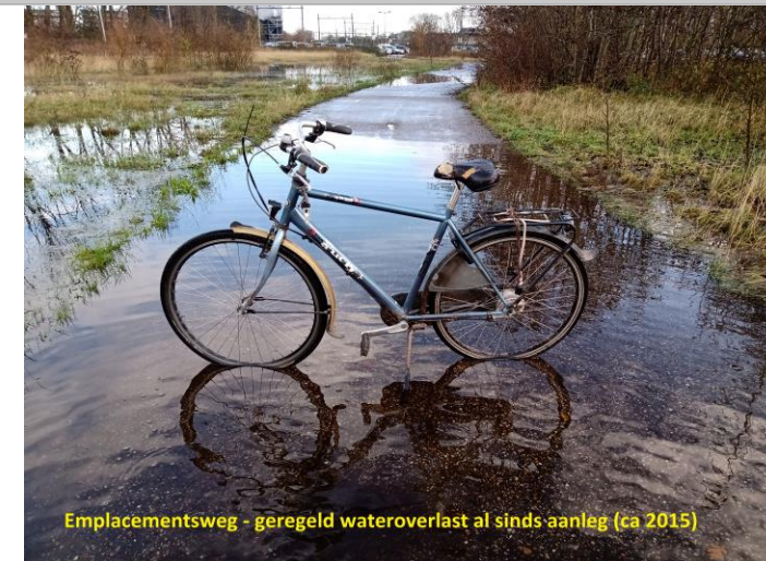
Emplacementsweg - geregeld wateroverlast al sinds aanleg (ca 2015)