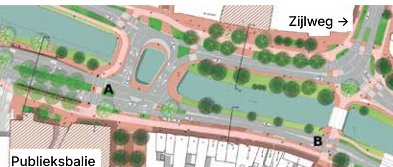
Figuur 1: Raaksbruggen gezien vanaf de centrumzijde

Ook op dit (dubbele) kruispunt verdwijnen de meeste verkeerslichten. Alleen de fiets- en voetgangersoversteek (zie figuur 1 Raaksbruggen, letter A) recht tegenover de publieksbalie