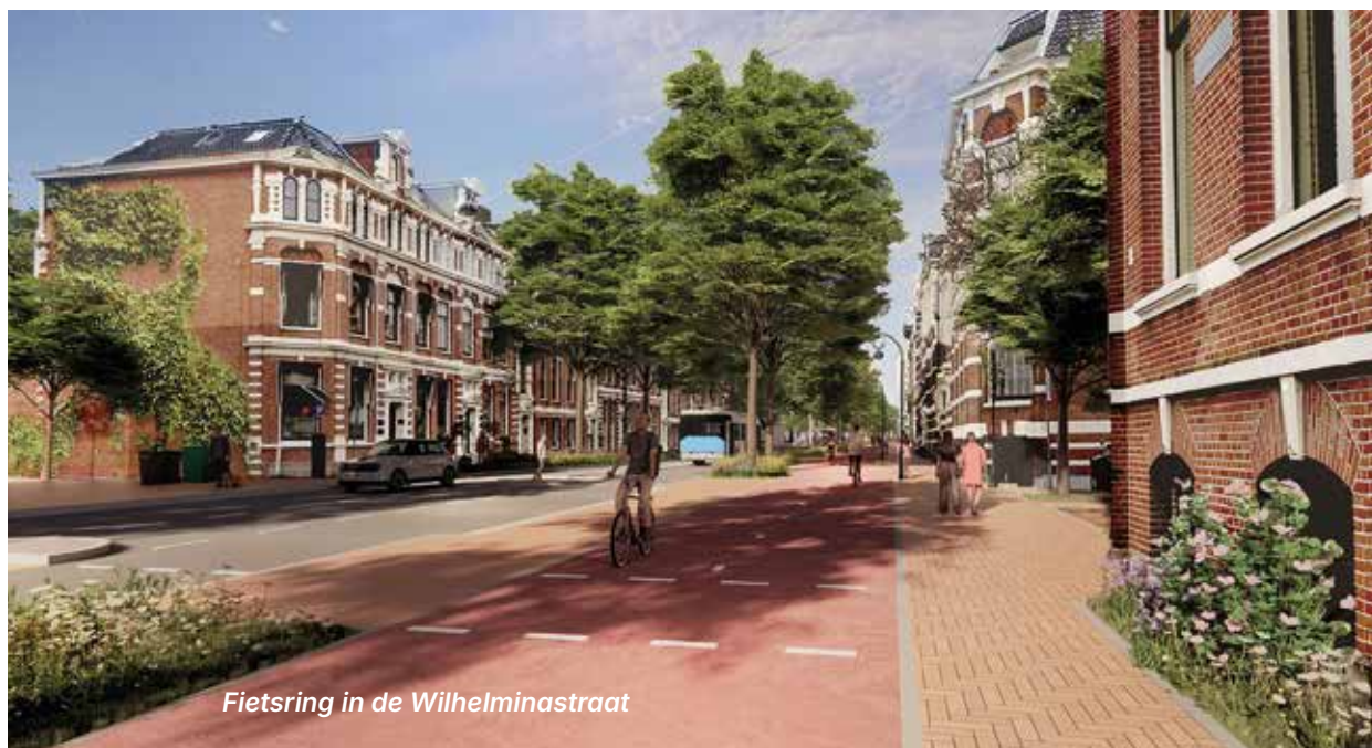
Fietsring in de Wilhelminastraat

>>> Vervolg van pagina 8 - Zijlvest, Wilhelminastraat en Raamvest