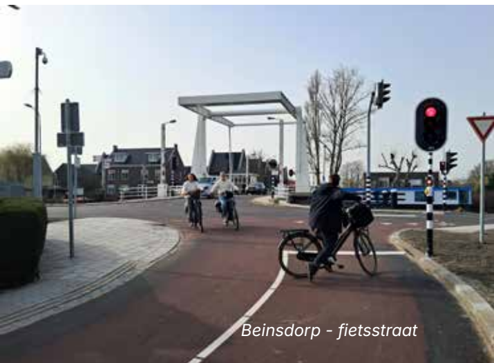
Beinsdorp - fietsstraat

Wanneer iedereen zich aan de snelheid houdt en rustig wacht op vrije doorgang, is er weinig aan de hand, maar daar sommige automobilisten denken te moeten oefenen voor de volgende Grand Prix, levert dit natuurlijk gevaarlijke situaties op. Dit heeft al geleid tot flink wat commotie. Het verkeer is door het gereed komen van de kruising bij de brug natuurlijk weer flink toegenomen (foto onder). Laten we hopen dat we ongeschonden de finish halen.