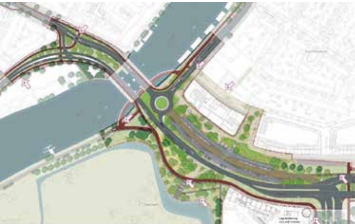
Figuur 1: OV-Knooppunt

Verwacht wordt dat het OV-gebruik de komende 20 jaar sterk toeneemt. Voor zo veel extra bussen is dan niet meer genoeg ruimte in de binnenstad en op het Stationsplein. Gezocht werd naar een andere plaats waar wel genoeg ruimte zou zijn. De Schipholweg (tussen de Buitenrustbruggen en de Europaweg) is hiervoor volgens de provincie en de gemeente de meest geschikte locatie. Eind 2028 wordt dit OV-station opgeleverd. Met de bouw wordt eind dit jaar een begin gemaakt, maar de voorbereidende werkzaamheden zijn al gestart. Dat hebben vooral voetgangers en fietsers al gemerkt. De toegankelijkheid per fiets is zeer beperkt geworden en er zal lange tijd fors omgerekend moeten worden. Zie ook pagina 7.