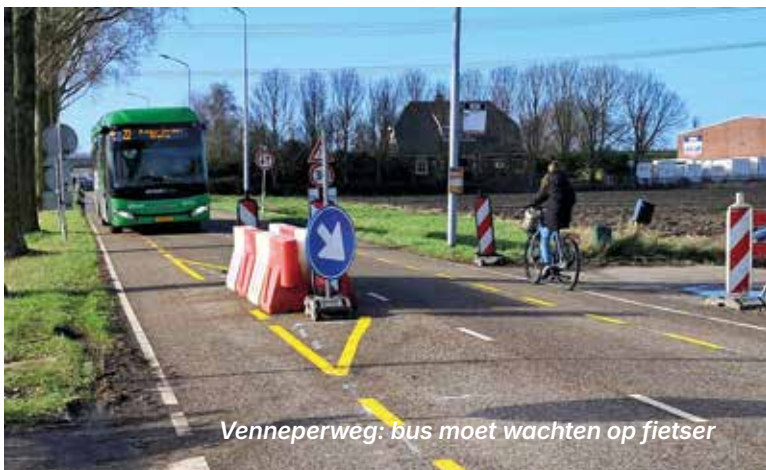
Venneperweg: bus moet wachten op fietser

Het fietsverkeer wordt daarom nu omgeleid. Gekozen is om de fietsers op de rijweg te laten meerijden. Deze oplossing is zeker niet ideaal,