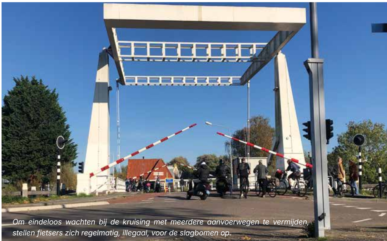
Om eindeloos wachten bij de kruising met meerdere aanvoerwegen te vermijden, stellen fietsers zich regelmatig, illegaal, voor de slagbomen op.

plan (VSP) vastgesteld. De fiets speelde hierin een ondergeschikte rol. Afgelopen jaar is dit VSP, op advies van de gemeenteraad, door een kopgroep van 30 mensen, waaronder vertegenwoordigers vanuit alle wijken, ondernemers en