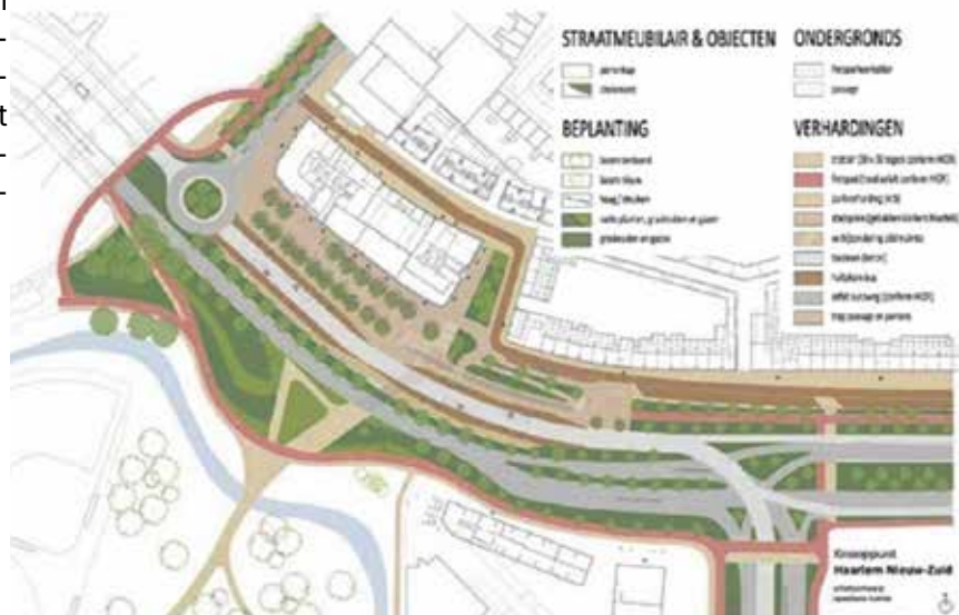
Figuur 2: OV-Knooppunt

3_+Bijlage+2+-+Vormgevingsdocument+(toelichting+op+DO)