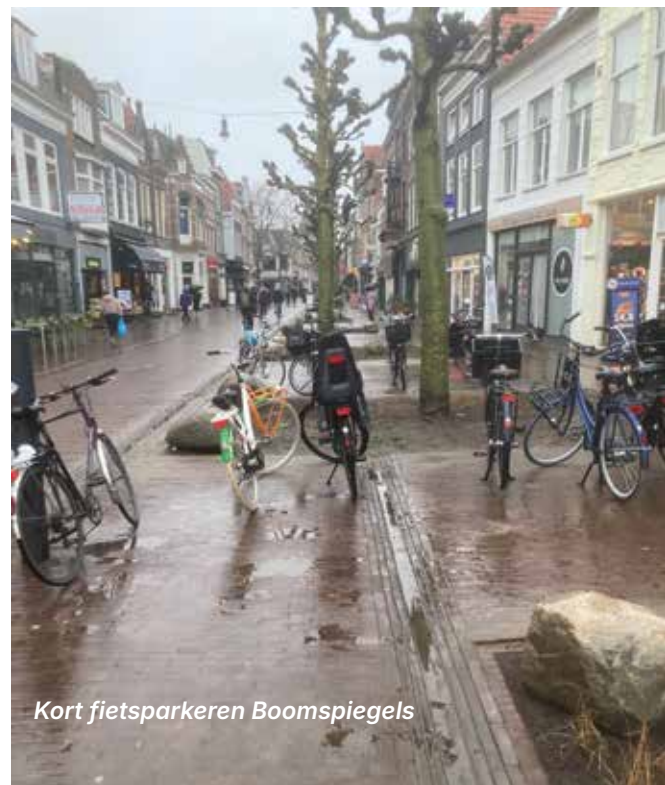
Kort fietsparkeren Boomspiegels